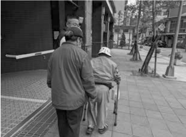
居服員陪同長輩外出練習走路 街坊鄰居過來關心給予長輩鼓勵