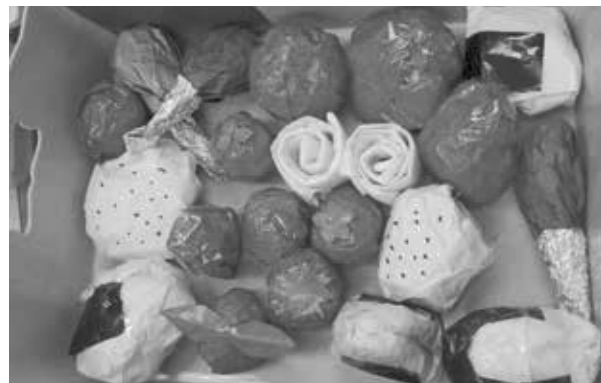
動手折紙樂，帶著好吃的飯糰、水果、蛋捲……一起去野餐！