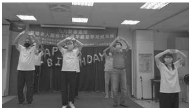
參加太極班展現成果