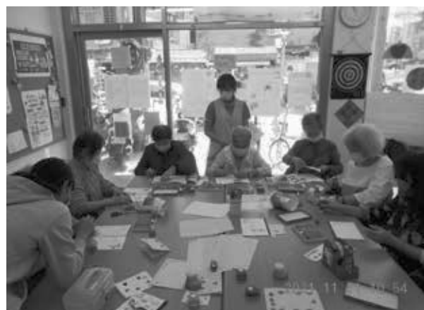
長輩參與手作課程