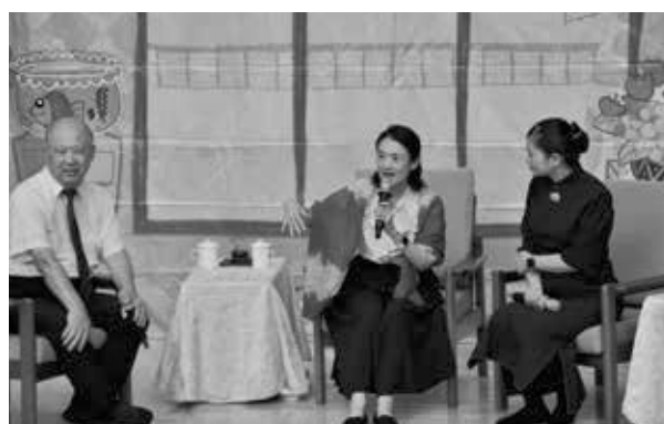
舞台劇演出後，安排專家與民眾進行映後座談