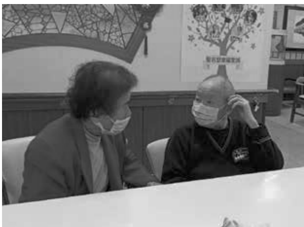
第一次飯後的聊天

某日與雙方家人提起他們在日照互相交流及關心彼此的日常，家人也都很開心，因為曾是很親近的鄰居，於是進一步安排讓彼此家人在接送長輩時順道聚聚，那溫馨動人的畫面實在讓人印象深刻，久久不能忘懷，常在我們的心裡留存，我認為這就是友善社區營造精神的具體展現！大家在知道長輩的狀況後，更多了一份關心，這兩位長輩就從老鄰居變成了老同學，看到彼此來上課會打招呼，說你來了啊！偶爾兩位太太相遇時，總能聊上幾句熟悉的話語，家屬說能在年老後再次遇見年輕時一起打拼的老鄰居，這緣分真的很可貴，我們也深深感受到社區的溫度，這就是台灣在地的人情味。