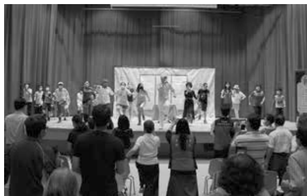
邀請民眾上台做大腦保健體操