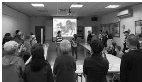
參加長青學苑與學員分享