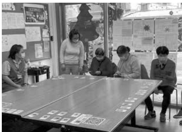
圖卡辨識訓練認知功能