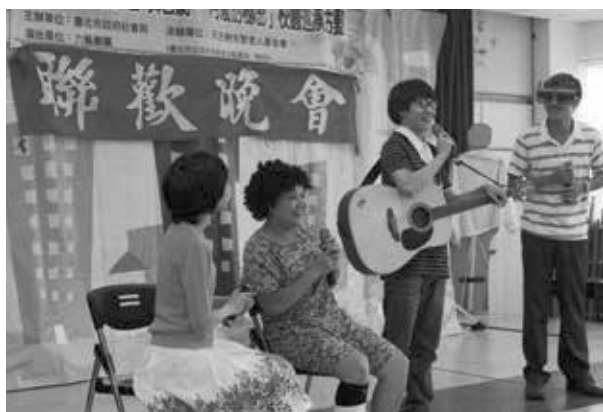
六藝劇團首次以〈阿嬤的秘密〉與基金會合作

在台灣的人口結構，已邁入高齡化社會，預防與面對失智症已是刻不容緩的工作，這一路走來，我們聽見現場的觀眾，因