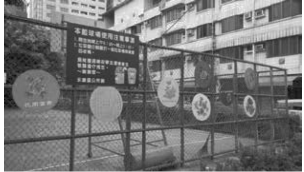
台南市永康區失智長者藝術作品布置於籃球場讓更多人看見