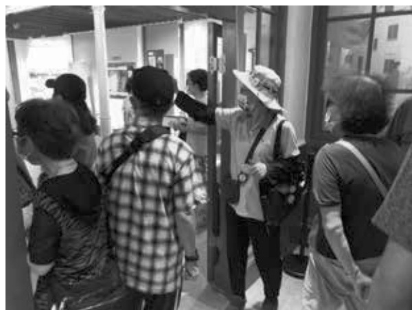
失智者來到植物園參觀