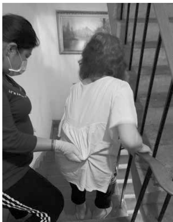
服務員一週兩次帶黃奶奶練習爬樓梯