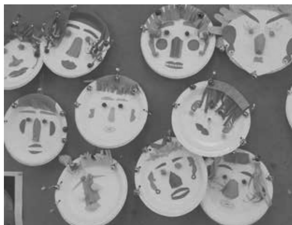
叮叮噹噹面具鈴鼓，猜猜我是誰？

氣。有機會就協助他們申請合適的照顧資源。透過傾聽陪伴，讓照顧者不孤單。而家屬也能透過網路互動得知失智者的第一手資料：看看FB活動照片、課務花絮，聽聽長者自己說出在石頭湯的趣聞。看到長者過得安適舒心，相信家屬們心中必定倍感幸慰。