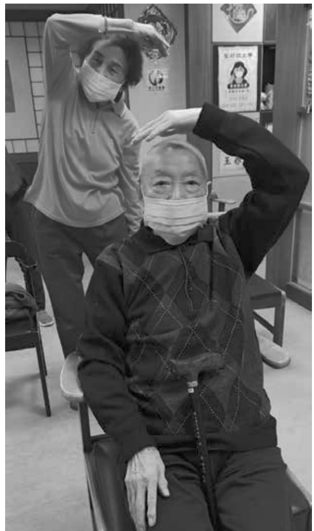
早上一起做運動的老鄰居

失智友善的開始也從關心社區的民眾起步，不要擔心說出家人的疾病，因為愛會超越言語所能帶來的感動，很多微笑和鼓勵的眼神會化成支持的力量，陪伴我們生活的每一天。