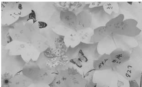
疫情四肆虐下，寫下溫馨的祝願--大家都要健康平安哦！