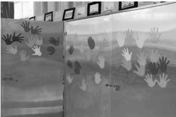
台南市永康區失智友善館中也布置了許多失智者的藝術作品十分美麗

因應擔任志工者多為已退休、年紀較大的長輩，因此在各個據點有製作失智友善服務諮詢手冊，讓志工需要時可以翻閱，也有提供QRcode，內含各種失智症資源給家屬，避免志工需要記住太多資訊造成壓力。