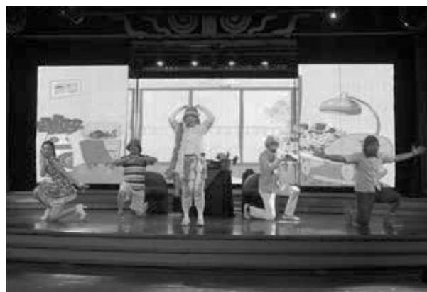
2017年首次登上麗星郵輪演出