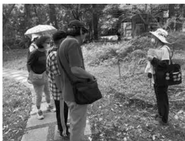
聽著導覽享受綠意盎然