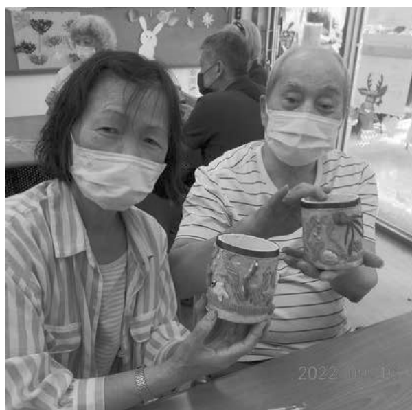
夫妻一同完成筆筒製作