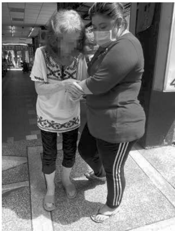
外出曬太陽補充維生素D

黃奶奶對於每件事情都有自己的看法及堅持，也很樂於分享，家中有新的電器使用前也會先詳閱說明書後才照著步驟開始使