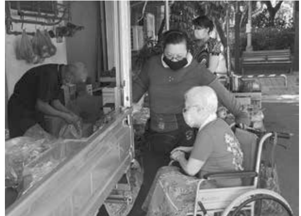
居服員陪同長輩到市場買菜 跟熟悉的攤販互動

功能逐漸退化，兒子開始用居家服務，讓居服員定期陪同阿嬤外出用助行器練習走路，街坊鄰居遇到阿嬤外出時，都會為阿嬤加油打氣，增加阿嬤的自信。