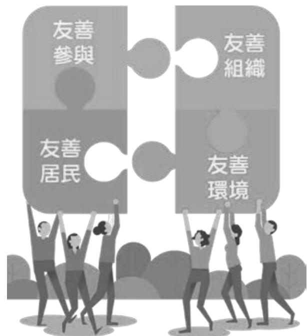
國民健康署提出的失智友善社區四架構