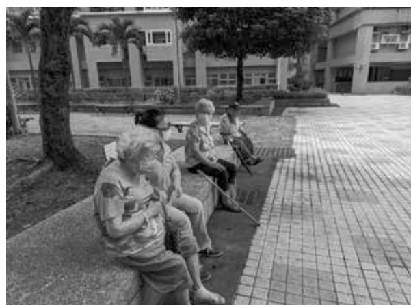
居服員陪同失智長輩到熟悉的公園散步 順便見見老朋友一起聊天