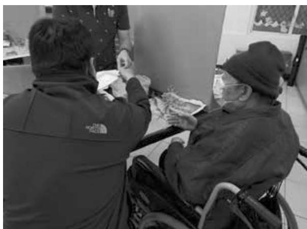
居服員帶失智長輩到據點參加活動 拓展長輩社會支持系統