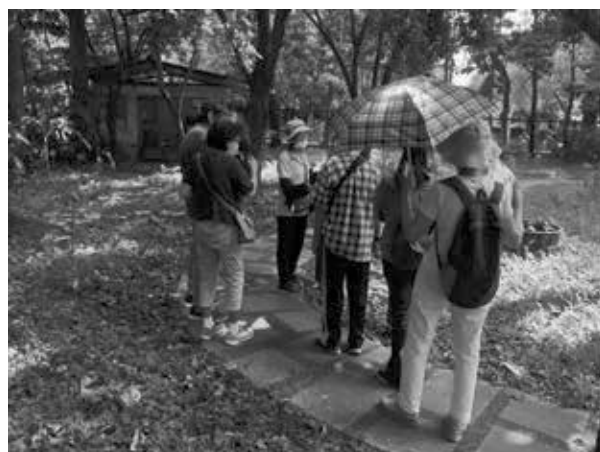
走在步道上感受大自然