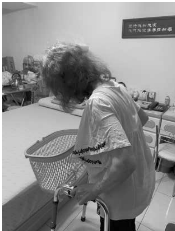
自製助行器籃子方便拿放東西

長期居住於國外的親友返台後也都感受到居家服務讓輕度失智個案使其功能維持，並讓長輩在地安心健康老化，並落實幸福呀。