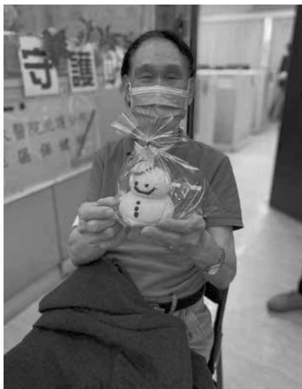
活動中總是能見到開心的富伯伯