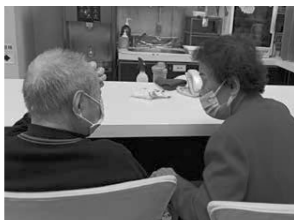
彼此關心家人的情況