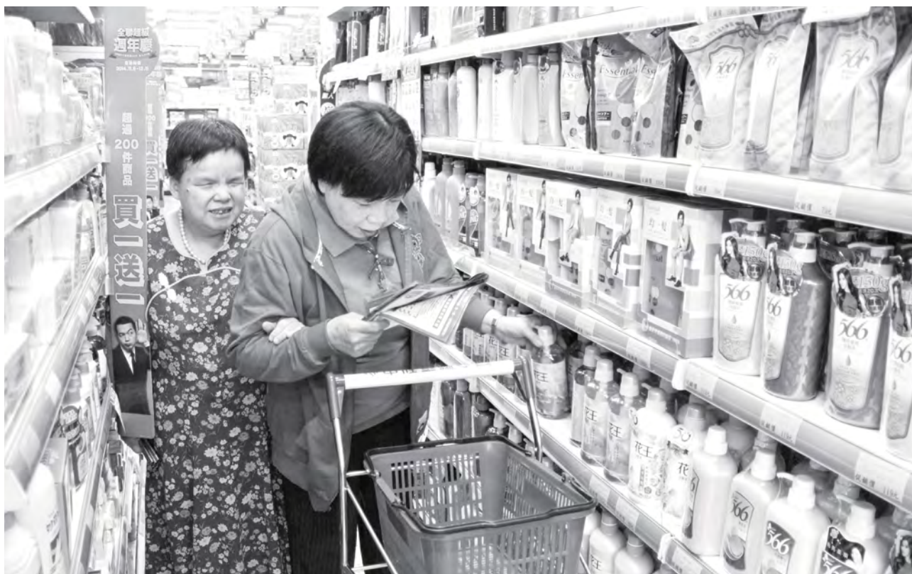
陪伴視障朋友購買生活用品

雖然環境並不是很友善，服務過程可能困難重重，還是有很多的服務員堅守崗位，並不輕易拋棄，雖然有些服務員的服務狀況出了問題，但是大多數的服務員都很盡責，不少機構的服務員也充滿朝氣和活力，隨著他們在專業上的發展和經驗的累積，許多服務員已經具有「達人的身量」，可以稱呼他們「失智照顧達人」、「精神疾患照顧達人」、「自閉個案照顧達人」、「抗壓達人」的身量，每次在教育訓練的場合，總是會被服務員的努力和專注所感動。提供額外服務的服務員可能不在少數，除了服務情境難以掌控之外，對案主、案家境況的關懷，確實是他們願意付出的真正的動力。服務員是需要社會的支持和肯定。