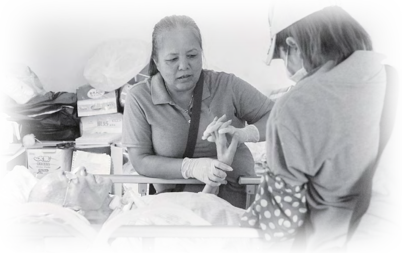
斗佈與同事一同服務個案