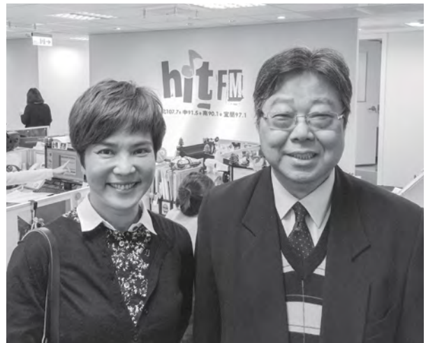
李艷秋（左起）與基金會鄧世雄執行長邀請民眾一同關心失智老人

本篇轉載於本會與聯合晚報合作「不能遺忘的故事」專欄，將24位名人陪伴失智親人的故事集結出版『失智怎麼伴？』一書，即日起捐款1,000元，就可獲得新書壹本。