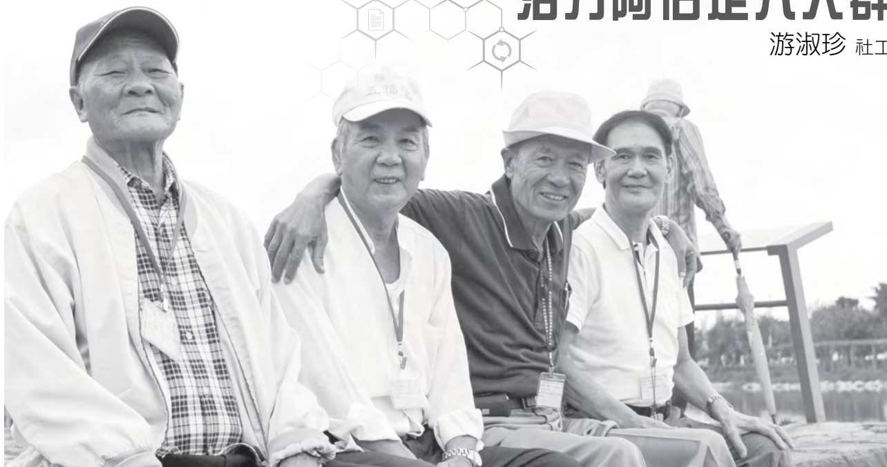
高伯伯參與中心辦理的社區長者戶外郊遊活動

「高伯伯你怎麼沒戴安全帽？」社工看著伯伯在中心樓下停機車，頭上卻沒戴安全帽不禁擔心地問著，而伯伯總是摸著頭上所剩無幾的頭髮，然後驚訝地說「唉呦！怎麼又忘了」。又有幾次社工在中心看到阿伯頭上戴著安全帽，詢問伯伯頭上怎麼老戴著安全帽？伯伯摸了摸頭頂，隨即難為情地說又忘記了。