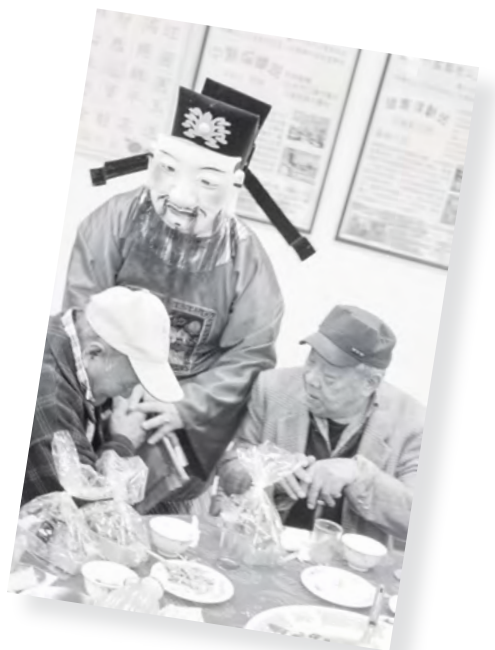
中國農曆年前圍爐，財神到，帶給長者祝福

雖然服務伯伯是一連串困難的決定，社區中獨居且患有失智症之長者，需要擔心的問題很多。如何在尊重長者意願持續自主地生活於社區中及考量失智長者獨自居住可能有的危險包含用藥問題、外出安全等兩者之間取得平衡，我們仍在努力中。