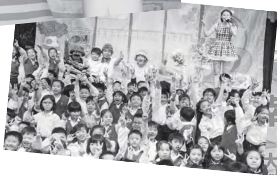
→阿嬤妮舞台劇自102年起，已巡迴38場次