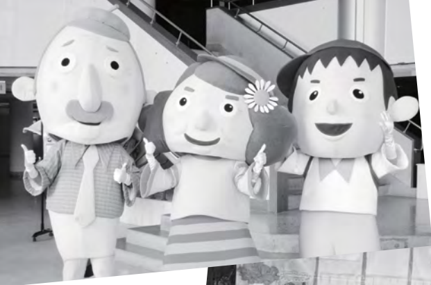
↑嘉明哥、阿嬤妮、阿迪一家人，一出場總是引起民眾注意