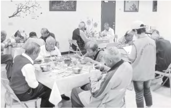
長者們中午到老人中心共餐，除享用頤養餐食外，亦可交交朋友增進人際互動

穩定就醫，但伯伯忘記來中心用餐的情形愈來愈頻繁了，身體狀況也愈來愈不穩定，走路總是會重心前傾，偶爾伯伯因重心不穩，騎乘機車外出時也曾發生跌倒的情形。社工每天總是提心吊膽的想：「今天伯伯還沒來用