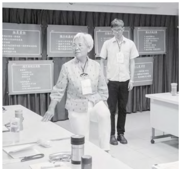
由惠姿老師帶領大家做耐力運動