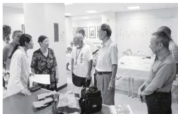
長者參加食堂活動，中興醫院營養師活動帶領-營養食材Q&A

在聯繫伯伯的兒女過程中，知道伯伯與女兒關係疏離，兒子患疾也無力提供扶養，社工除聯繫子女外也協助申請經濟扶助，盼能使伯伯生活穩定，期間為了減少伯伯的生活支出也請伯伯中午來中心用餐，就這樣伯伯每天中午騎著他的小50機車至中心用餐。