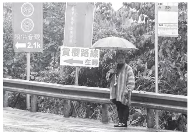
斗佈正前往服務個案的道路上