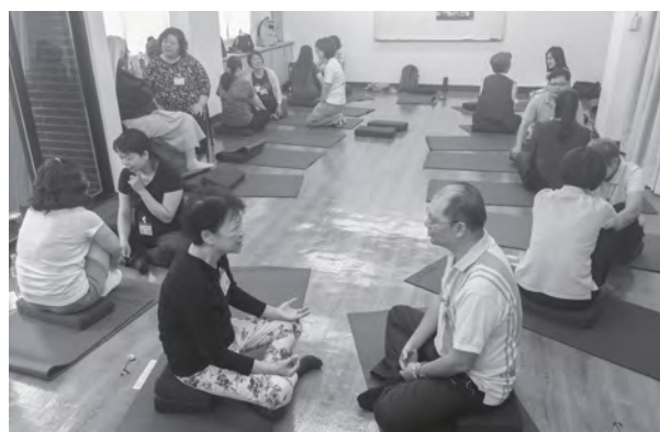
學員進行參與心得分享

我們都渴望身心靈的完整，只是我們未必能感受到完整的自己。「正念」不但可以協助我們在壓力中妥善處理情緒，帶來心靈上的滿足，更能統合感覺與經驗，喚醒與體現完整的自己。今年度我們將辦理三個梯次，邀請現職的失智症照顧臨床工作者來參與，希望跟大家一起再次找回投入長照的初衷，挖掘潛藏在自我深處的美麗寶藏。