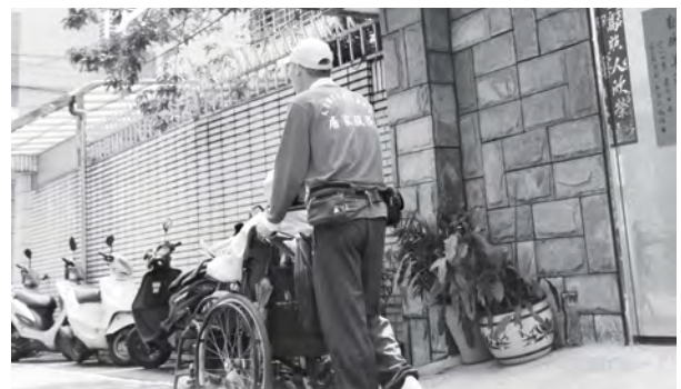
照顧服務員，陪伴長者到社區散步