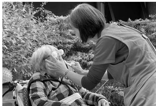
玉蘭姊細心地幫長輩擦臉