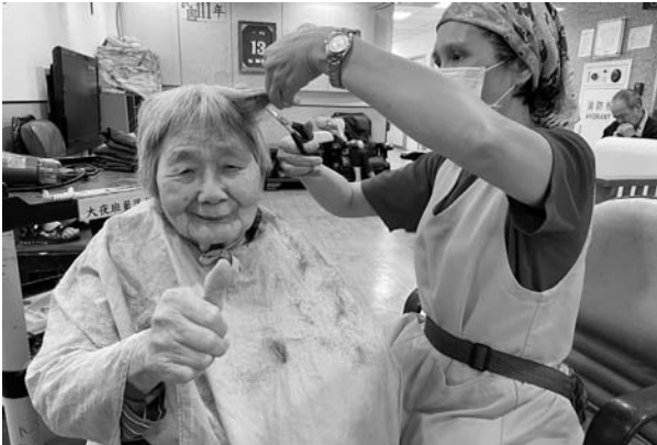
疫情時，玉蘭姊展現第二專長，幫長輩剪頭髮

此研究結果顯示照顧服務員個人若能為自己目標，充實自己學識及專業，且應用於專業領域上努力去完成，或是在遭遇挫折困難時，能堅持到底、面對現實繼續嘗試，將有助個人提升自我效能外，也能提升組織認同的信念程度。