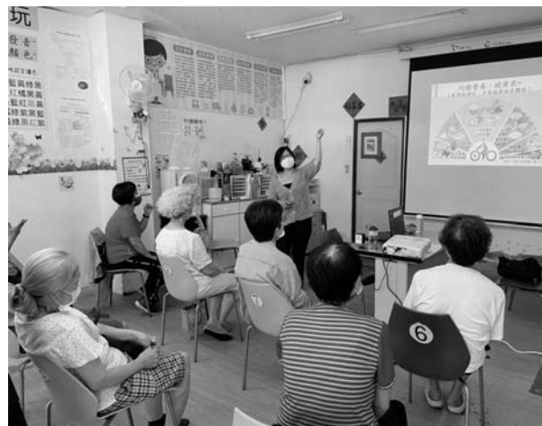
邀請和平婦幼營養師分享我的健康餐盤