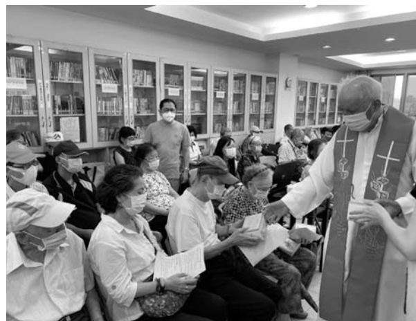
年節祝福活動帶給長者內心平安