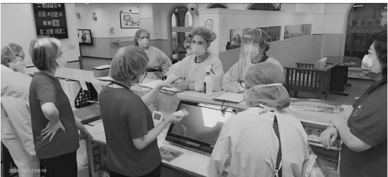
一起研擬面對疫情的工作流程

近年來 因應社會需求，各類型長期照護機構陸續興建，照顧服務員是最重要的人力資源，照顧服務員是否願意配合機構所訂定的照顧模式執行，繼續為機構奉獻心力堅守崗位，或是否願意留任機構為共同目標而努力，都是影響機構永續發展及提供住民良好的照護環境的重要關鍵要素。