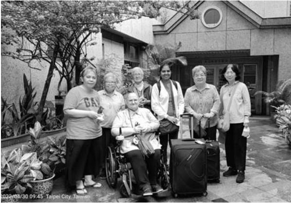
聖母聖心傳教修女會合影