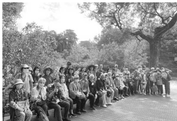
感謝台灣銀行贊助，讓獨居老人開心出遊