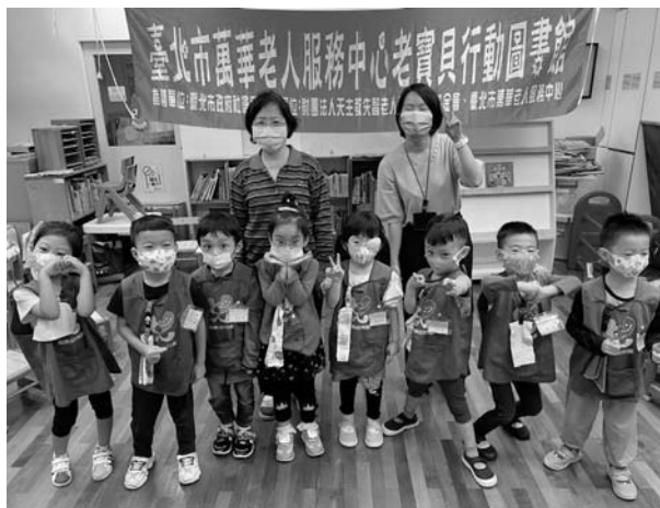
老寶貝行動圖書館