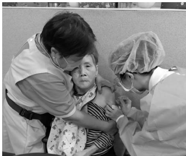
長輩施打疫苗從懷疑抗拒到淡定配合

防疫期間最基本也最重要的防疫觀念是手部衛生，我們利用淺顯易懂的方式教導長者防疫觀念並練習洗手與戴口罩，除增加洗手的次數外，用餐時也自製隔板讓長者在更安全的環境下用餐。還有配合疫苗施打與定期篩檢，感覺每一次都是不可能的困難任務，但也讓我們見識到長者驚人的潛力，從懷疑抗拒到淡定配合，展現超強的適應能力。