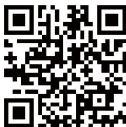
「憶見美好 霹靂樂齡生活」關懷獨居長者影片

本活動也感謝威秀影城、台灣大車隊股份有限公司、曼都股份有限公司、台灣大哥大股份有限公司、金玉堂文具批廣場、尚智運動世界的公益宣傳贊助。