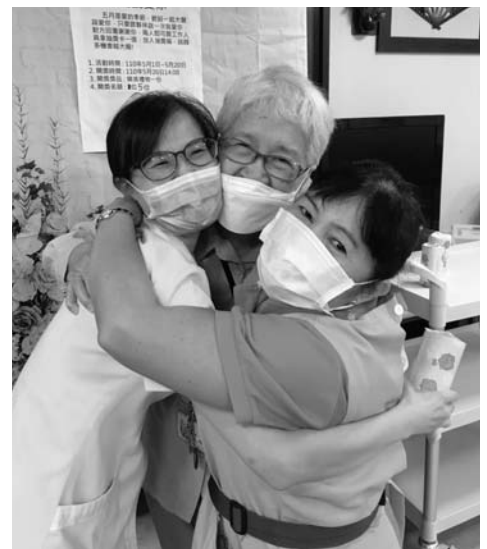
修女，我們永遠懷念您～