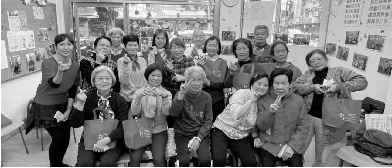
聖誕感恩暨畢業典禮

因自身健康因素，無法施打疫苗，變成不能參實體活動，實屬可惜，因此石頭湯也因應不同的課程和活動提供臉書直播方式，讓長輩或是照顧者也能線上一同共樂，反而也增加了跨區跨度的人來認識石頭湯、認識長照服務。