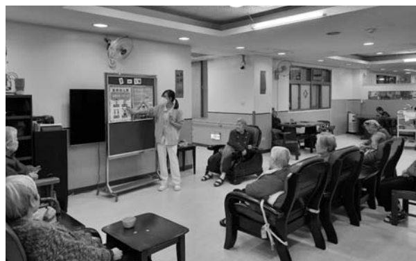
淺顯易懂的方式教導長者防疫觀念

感謝衛福部補助完成部份設施設備汰舊與更新，以及環境修繕工程，提升長者生活舒適與照護安全，落實優質照護服務。我們持續提供連續與多元服務，具體提升長者及照顧者的生活品質。除繼續穩定提供失智長者的全日養護服務暨日間照顧服務外；努力嘉惠社區中有照護需求的失智症者家庭提供機構喘息服務，感謝團隊的努力與各界支持肯定，將成果獻予天主！