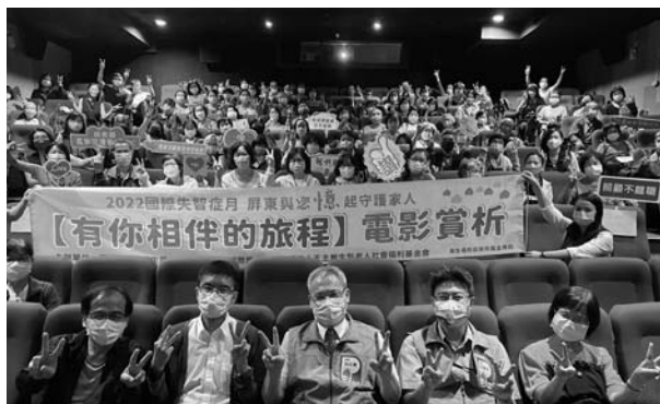
國際失智症月《有你相伴的旅程》屏東場合照

本會自102年起，攜手六藝劇團辦理《我愛阿嬤妮》舞台劇，10年來向下扎根深入全台鄉鎮，今年首次來到嘉義縣，完成全臺各縣市巡演拼圖。本劇內容重新改版，融入社區照顧關懷據點、建立健康生活型態、失智友善及源自臺北市立聯合醫院失智症中心設計的與失智症者的互動技巧「STE2P」溝通5撇步：「微笑、謝謝、眼神接觸、擁抱當下、耐心。」今年度辦理5