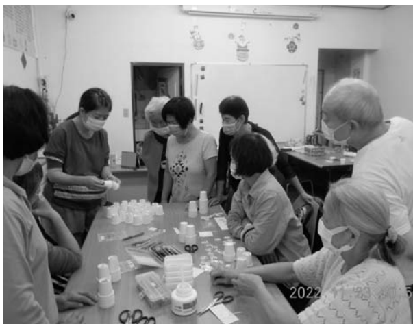
自己動手製作桌遊

隨著疫情趨緩，石頭湯全體同仁和大多數長輩皆是抱著既期待又緊張，還有擔心的心情，等待復課那一天的到來，而有些長輩