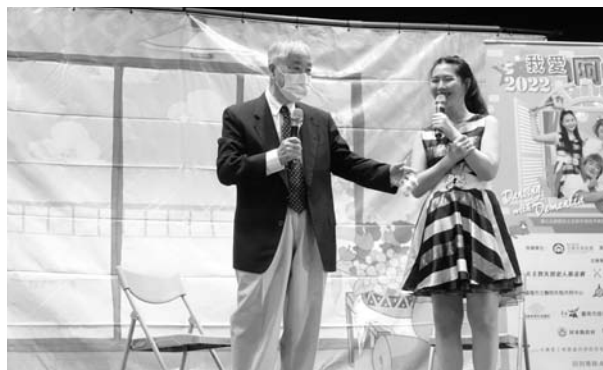
資深氣象主播李富城，現身分享