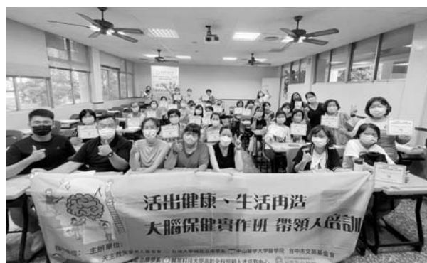
活出健康-生活再造 大腦保健實作班 帶領人培訓(台中場)

感謝各方在2022年對於教育研究組所推動的失智症照顧者支持教育、專業照顧者訓練課程、失智症預防與延緩生活型態方案和失智症音樂照顧方案的大力支持與協助。在未來，我們將繼續努力推動更多的照顧者支持和失智症相關領域的計畫與研究，幫助更多失智症照顧者和失智者的生活過得更更有品質與尊嚴。