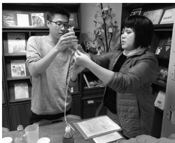
督導員練習管灌技巧