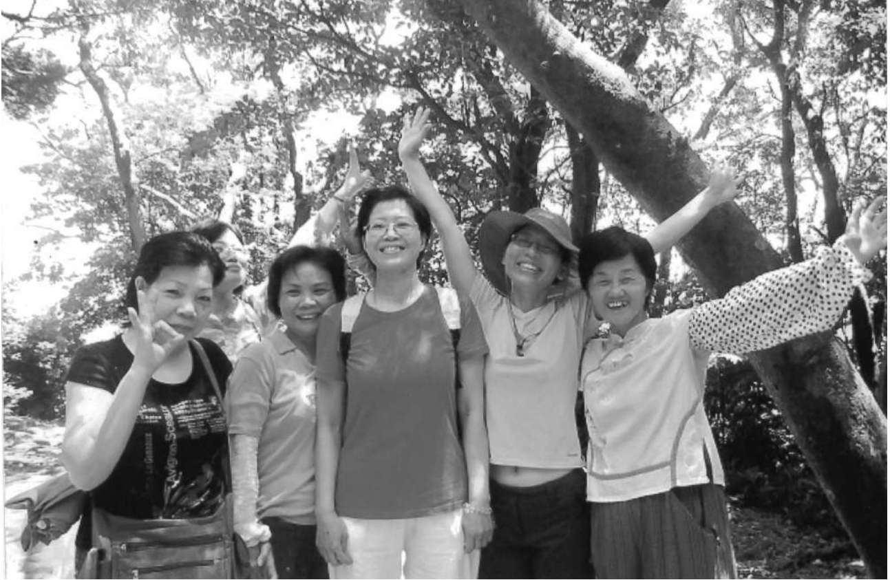
與同事們一同出遊