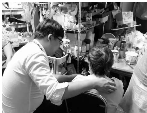
專業人員居家訪視