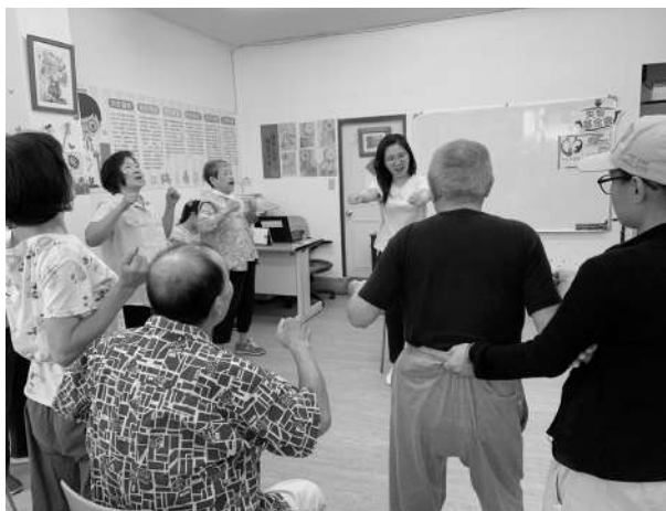
延緩失能 據點社區復健課程

萬華石頭湯是什麼店啊？這是據點剛設立時最多人詢問的問題，石頭湯可不是賣吃的呢，經過了這一年多來的經營，越來越多人認識我們，知道萬華石頭湯是一個能讓萬華區長者及家庭照顧者參與活動，和放鬆喘息的地方，也知道這是一個讓社區民眾可以就近獲得與長期照顧相關服務的長照服務據點。