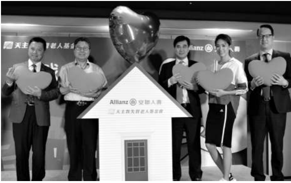
《I·我愛我，慢性病遠離我》募款活動記者會