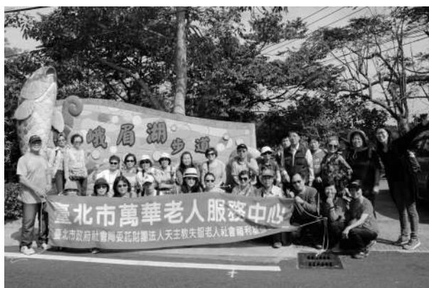
獨居長者郊遊活動

中心擁有健全的志工人力資源，並持續提升志願服務者的質與量，運用志願服務人力持續且穩定的投入老人服務工作。108年度有58位志工提供服務，貢獻服務時數達12,867小時。在社區中工作，志願服務者是我們很大的助力。舉凡打電話問安、帶早操、量血壓、送便當及陪伴長者聊聊天等，