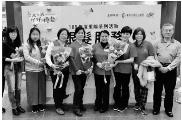
2019北市照顧服務員表揚

上美好的連結，我們深深感恩大家友善的幫助，讓更多人看見長者的能力並得到尊重與肯定。