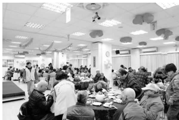
春節圍爐送暖餐會

2020年，萬華老人服務中心即將邁進服務第十二年，期望在體系【愛主愛人、尊重生命、四全服務】的理念基礎上，透過多元、專業、團隊的服務，持續協助萬華社區老人維持社會功能並提升生活品質。