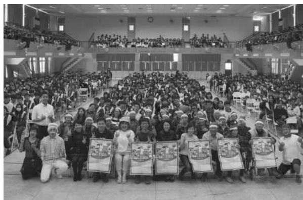
《我愛阿嬤妮》公益舞台劇巡迴 台南北門高中場