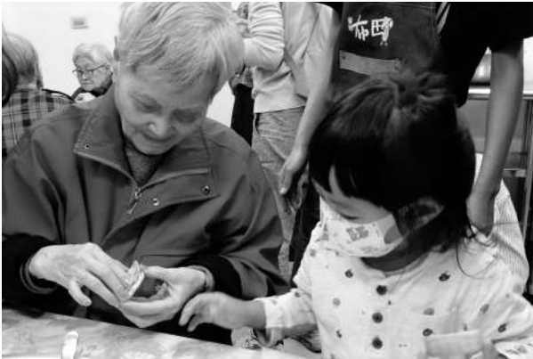
結合友善商家社區共融活動