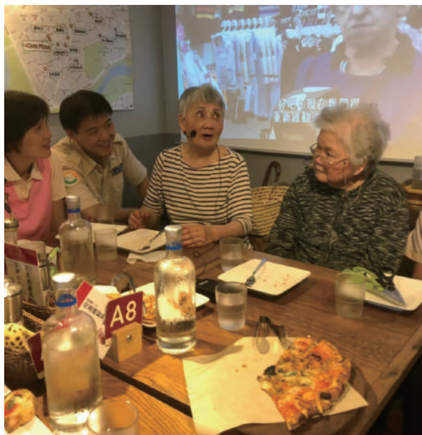
工作人員陪伴前往Cura Pizza做社區交流