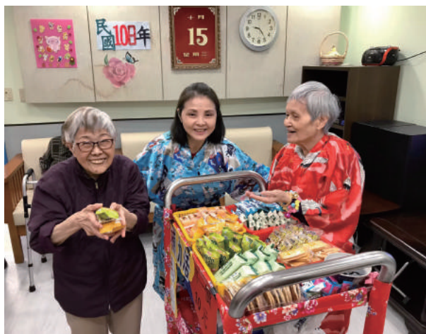
長輩也是行動柑仔店的老闆娘