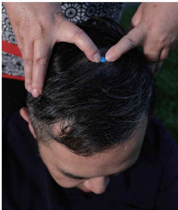
百會(圖1)耳尖向頭頂直上正中交會