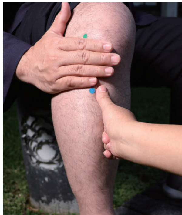
足三里(圖4)膝眼下四橫指