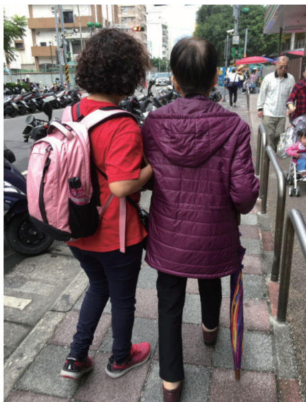
服務員陪同長者外出散步，也可以讓家屬獲得喘息空間