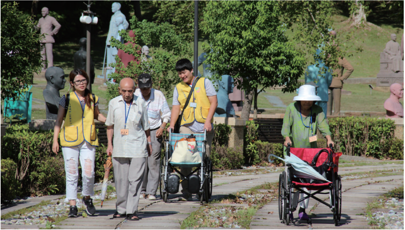
▲每年萬老郊遊活動，由社工及志工陪伴