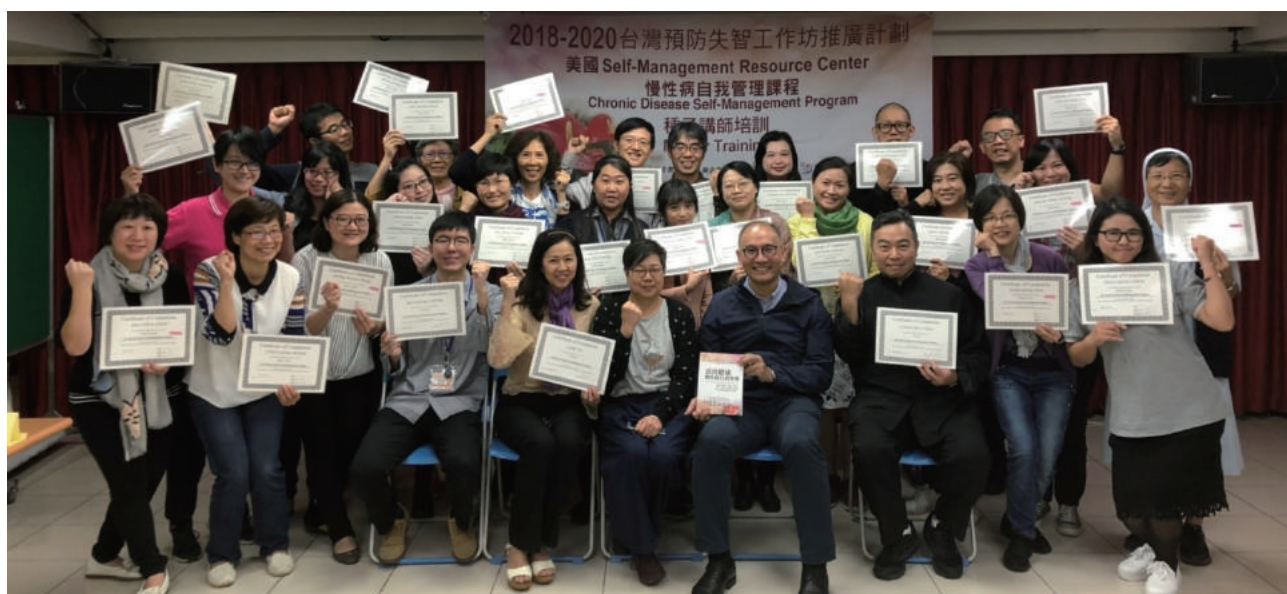
2018年第一批種子講師結訓大合照