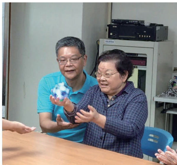
家屬陪伴蔣媽媽一起參加黏土活動

漫長的陪伴之路，要能保持陽光心態，除了照顧者本身強大的心理素質，更需要整個團隊、整個社會的共同支持。我深深祈願未來我們能建構更友善的環境，讓失智者及照顧者無所掛慮，能更安適地有品質與尊嚴的生活。