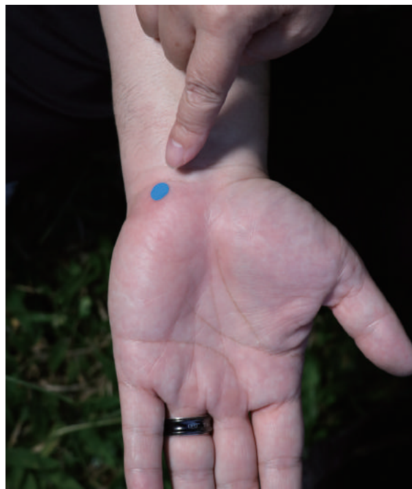
手神門(圖2)腕橫紋上尺側凹陷