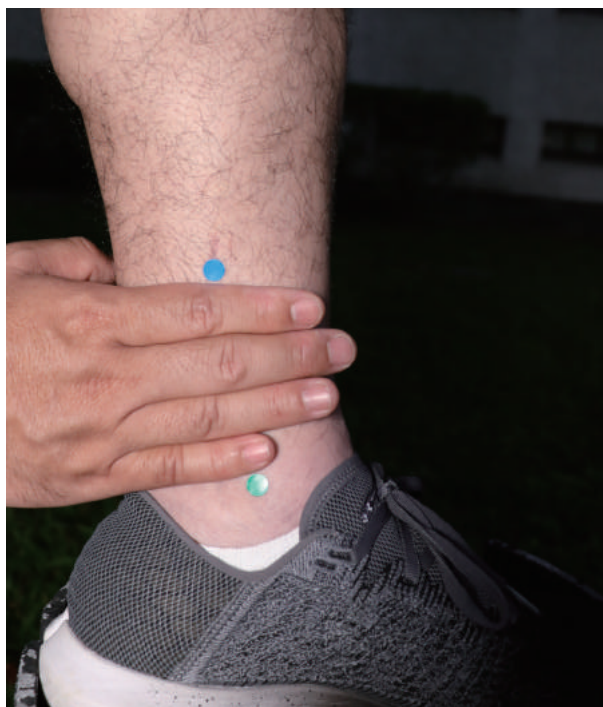
三陰交(圖5)內踝關節上四橫指