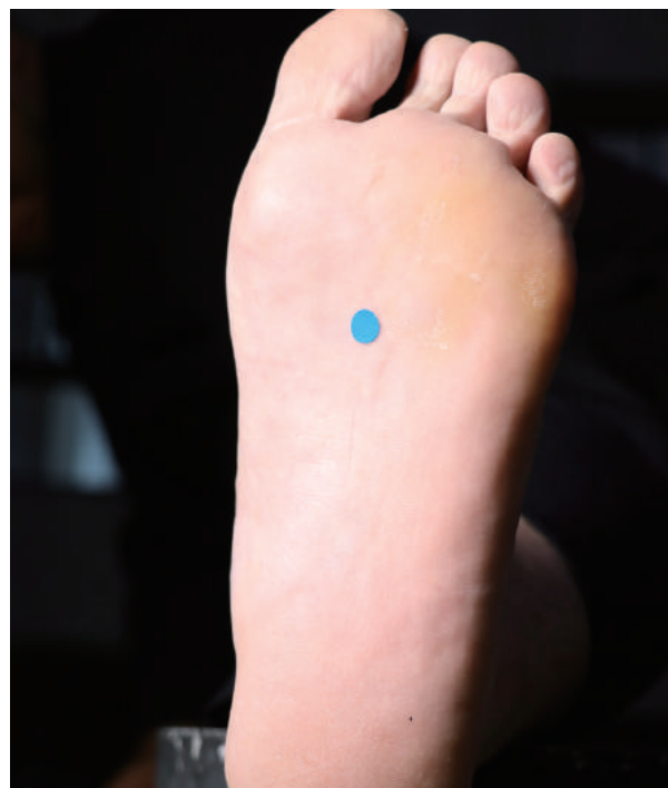
湧泉(圖6)腳底上1/3凹陷處