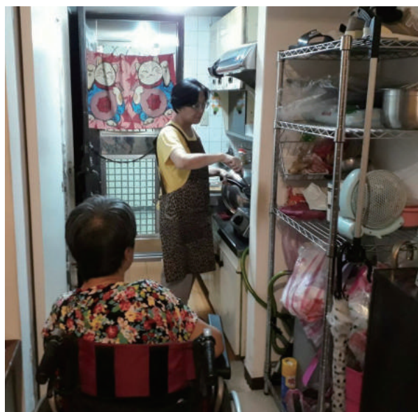
吳媽媽將居服員當成好夥伴傾吐心事