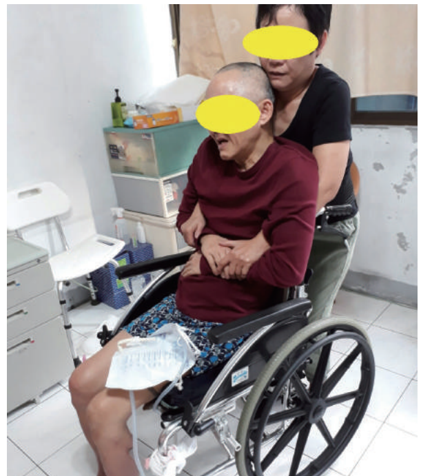
二姊協助阿祥移位

二姊坦言在娘家投入的心力真的很多，偶而沮喪時還向丈夫抱怨如果自己是阿祥這樣可以被姊姊照顧該有多好。二姊心理知道，丈夫是她最強大的後盾，她非常感謝丈夫的協助與諒解。阿祥已屆齡54歲，目前唯一照顧他的二姊年紀及身體狀況也會漸漸的衰老，這點最讓她感到憂心忡忡，擔心當未來自己無力再照顧阿祥時，該由誰來接手呢？「如果滿分是10分，照服員的協助是3分，個管師、居督員、照管專員則占了7分」，對於長照服務資源的介入，二姊非常感謝長照服務資源及早進入，在阿祥事故後出院能馬上提供照顧。A單位個管師能了解並幫助阿祥照顧上的需求之外，也經常與二姊電話聯繫關懷她的狀況，對於不輕易向旁人傾訴內心的二姊，這樣持續的傾聽與同理，幫助她清理了許多心中不愉快，讓她有動力繼續為家人努力。