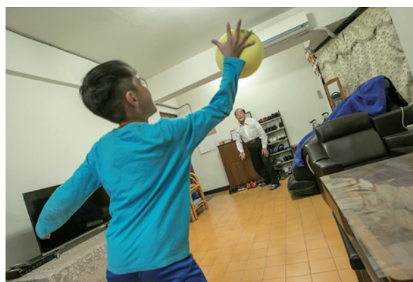
祖孫的樂趣，玩海綿球，同時也增加運動的機會，增進自我的健康