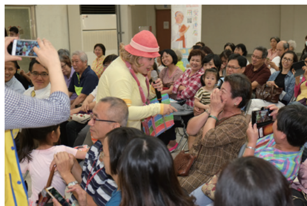
阿嬤妮與現場的民眾互動同樂