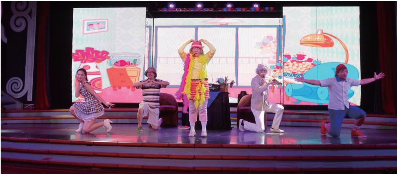
106年首次登上麗星郵輪演出