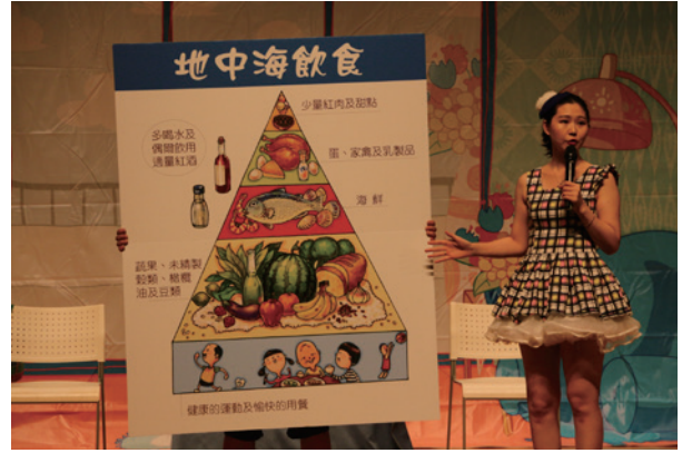
劇中特別穿插地中海飲食方式介紹