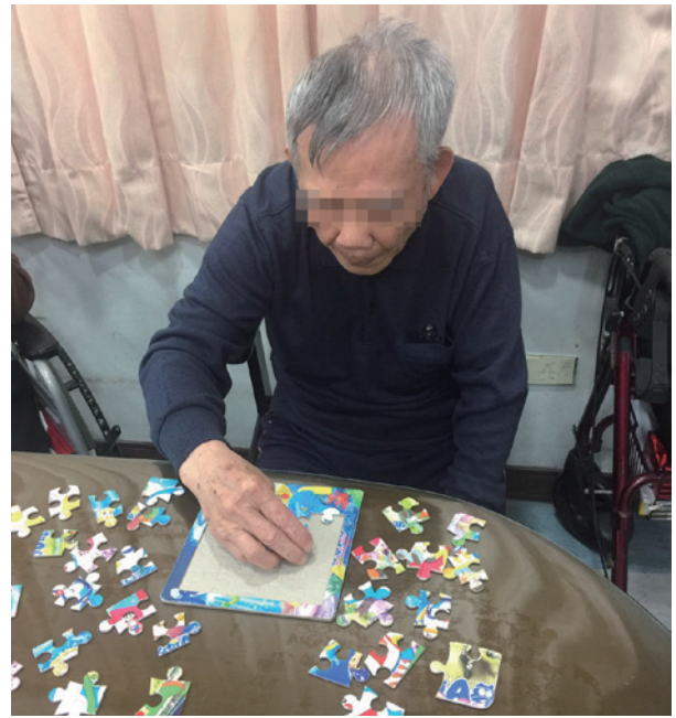
神情專注動腦拼圖中