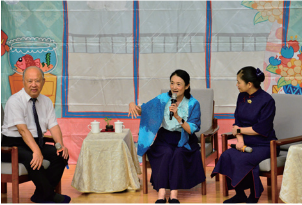
舞台劇演出後，安排專家與民眾進行映後座談