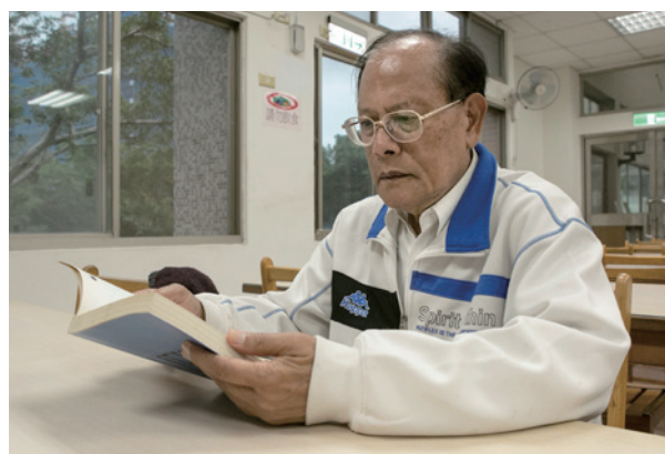
喜愛閱讀，不斷接收新知，也是腦袋活化的方法之一