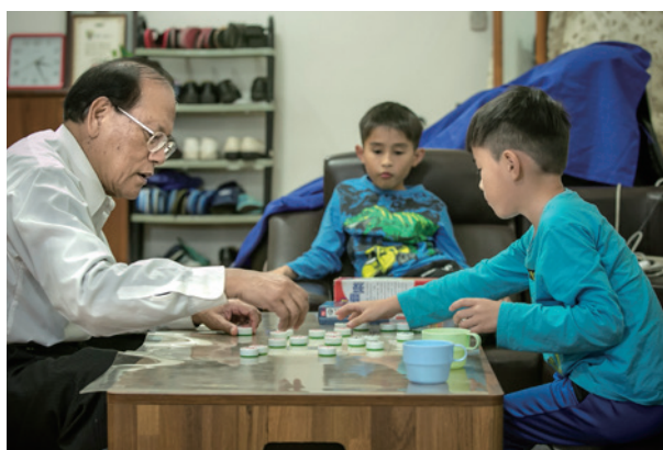
透過與孫子下棋，增進自己的思考能力