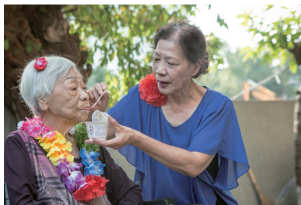
失智者照顧失智母親

白女士分享，感謝在最困難時期，有長照2.0的幫忙，一周三次的居家服務，幫媽媽洗澡、整理居家環境，減輕不少照顧壓力，讓自己能夠得到喘息。同時也以過來人的身分鼓勵大家：「生老病死是必然，不要擔心跟害怕，但要懂得尋求資源，要面對、要多接觸人群，努力走出來。」也期盼社會大眾能以更多的關懷與體諒取代異樣眼光，進一步的從路標改善達到失智症的友善社區。