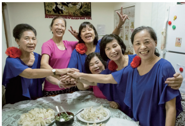
親友陪在身邊是最大的力量

發現自己的變化，對自己逐漸感到「失志」的白女士，在危機意識下迅速的就醫，於105年5月確診為輕度失智症，儘管經歷過照顧媽媽，而對失智症有一定程度的了解，但對於發生在自己身上，依舊很難接受…甚至連周遭親友都不願相信，認為只是健忘，這段期間沒有家人的後盾，日子走的更加辛苦。白女士曾經長達半年至一年期間不出門，把自己關在家，不敢面對外面的生活，與他人的眼光，因為無法相信自己有一天會罹患失智症，曾經在教育界有一番成績的自己、以前很擅長的事情都變得失去能力，內心感到相當挫折。