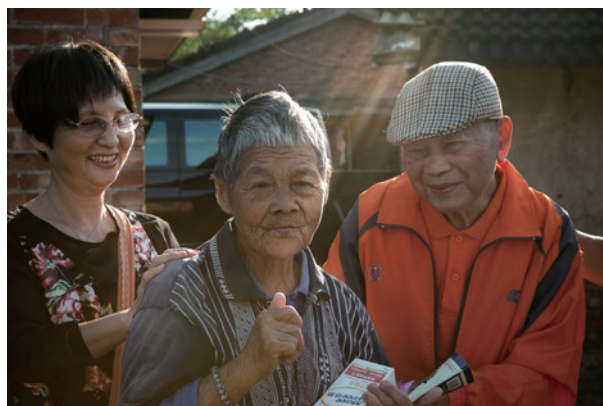
成立大林志工站，關懷獨居老人