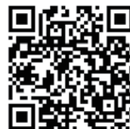
我親愛的父親 官方30秒預告

本片將於2/12週二晚間九點於緯來電影台播出，並上傳本會網路平台，敬請密切鎖定。自即日起，本會開放各單位申請公播，將無償授權使用，歡迎電洽02-2332-0992分機111 陳企劃。