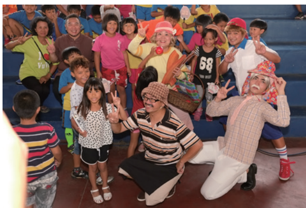
來到偏鄉屏東牡丹演出

能演到100場，實在是寥寥可數的。除了非常有名的劇團、除了非常經典的戲、除了有政府雄厚的財力物力的支持之外，其他的演出要能有機會持續一百場，一般來說是沒有的。要靠民間的力量，自發性的推動一個宣導演出，而且持之以恆，夙夜匪懈的年復一年推動，這真的是太難得了。