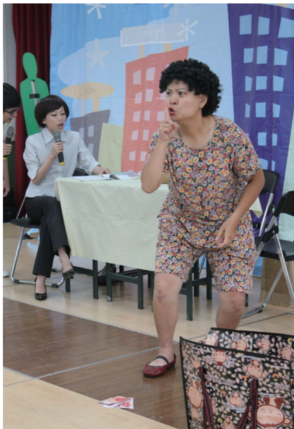
劇團首次以「阿嫲的秘密」與基金會合作

每一年的演出都嘗試聚焦一個主題，從認識失智症、失智症的十大警訊介紹、失智症的預防、健康飲食習慣、健康計畫表等，每年不同的主題，用不同的表現方式及內容，更重要的是，這齣宣導演出，可以說是老少咸宜，大小通吃。劇組的演出，來到了社區，和婆婆媽媽，爺爺奶奶打成一片。來到了小學，讓小朋友目不轉睛，哄堂大笑。來到高中職，讓高中生尖叫連連，瘋狂不已，跟社區幹事，跟校長教官，跟父母長輩，都互動零距離，從沒有一齣這樣的演出，從幼稚園到九十歲，都可以開心看演出，開心玩互動。演出中，台上的演員熱情的跟觀眾台上台下打成一片，其中的各個橋段，更是讓台下的觀眾嗨到極點。腳色和台下的貴賓玩著打情罵俏的遊戲，讓台下的觀