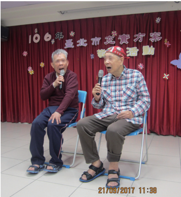
才藝大賞引吭高歌