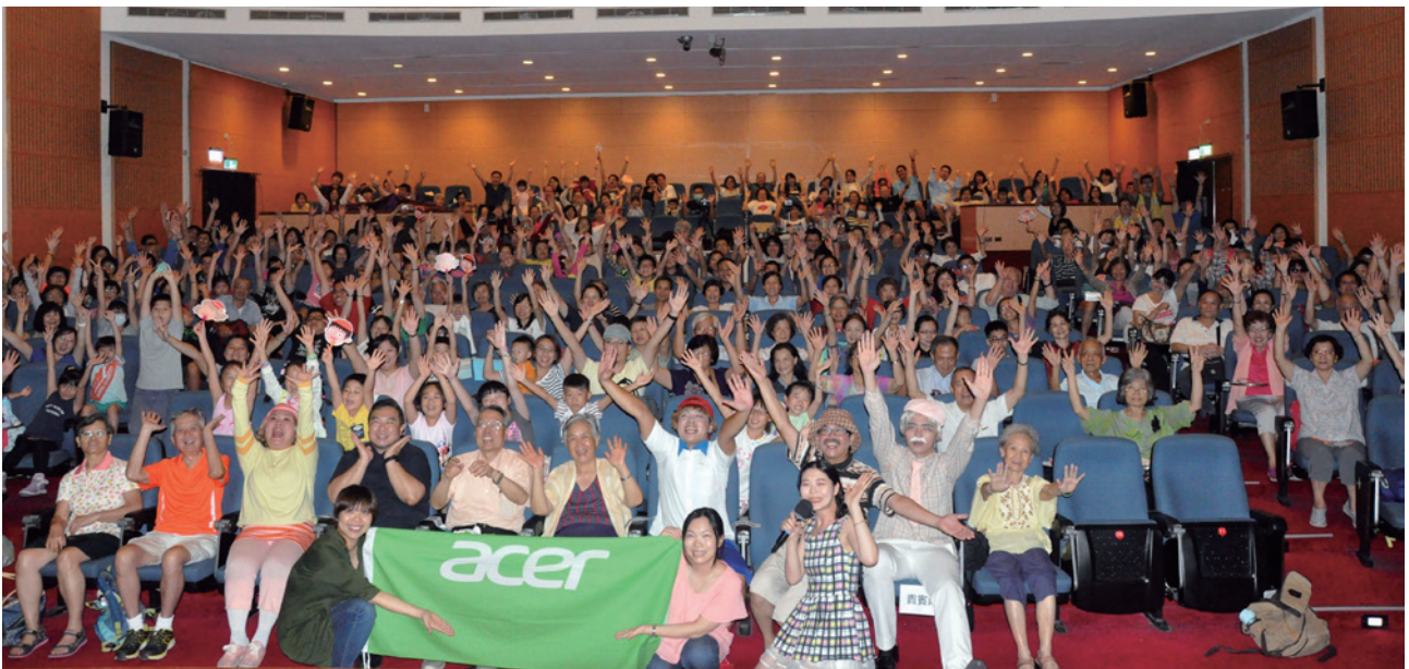
首次企業場合作，感謝宏基股份有限公司對於失智症議題的關注