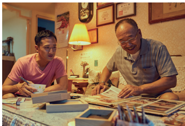
我親愛的父親劇照