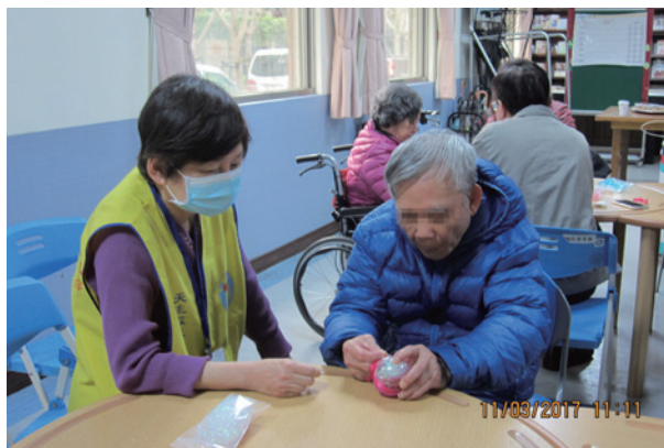
志工陪伴動手創作

他真的做到自己的承諾，努力在機構中適應，積極參與各種活動，很喜歡唱歌的他，經常主動大方展現好歌喉，舉凡「愛拼才會贏」、「媽媽請妳也保重」等台語歌曲都是他的拿手招牌歌。每年的才藝大賞活動，他總是最專注的參與者，除了上台高歌外，也不時以口號與掌聲為大家加油打氣！工作人員常說他是各項活動中的模範參與者，雖然入住機構期間也不免因身體健康概