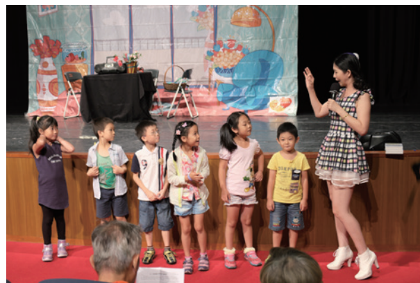
主持人與台下孩子們互動