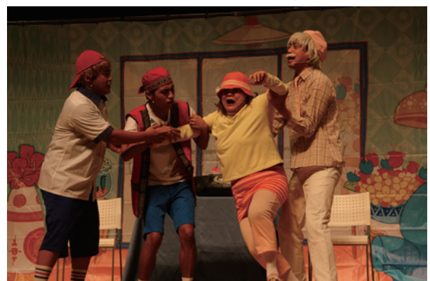
演員們在台上盡情演出，讓台下民眾熱情投入

走過千重山，看見的是一重又一重的風景，更重要的是，風景裡面一群又一群共同努力的人們，一起奮發往前，並擁有著孜孜不棄的信念與同舟共濟的情感。千重山，萬重水，但願足跡踏遍，人情更美，春風拂過，邁步向前。