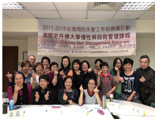
慢性病自我管理課程第十梯次大合照