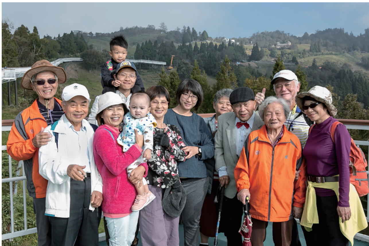
家人的陪伴，是最溫暖的力量

出門開車時總是想睡，停車等紅燈也睡，常出小車禍，之後漸漸覺得奇怪，怎麼樣開都到不了家；曾經一直往前行，轉