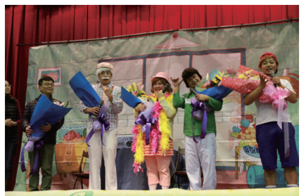
獻花給六藝劇團的演員們