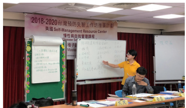
實際演練，是課程重要一環。

期盼未來，我們不僅僅是服務到失智症高危險群，慢性病患或家庭照顧者，我們自己與身邊的家人、友人，也能著實的從這個課程的受惠，預約一個不失智的未來，就從慢性病自我管理作起！