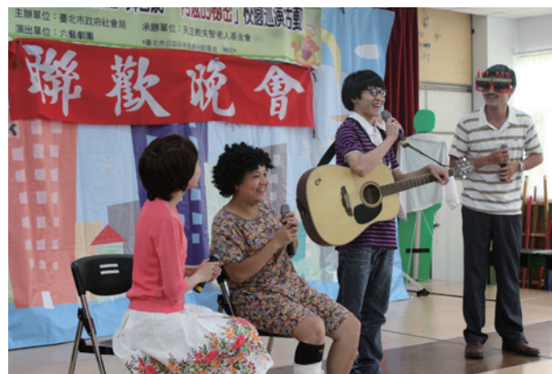
劇團首次以「阿嫲的秘密」與基金會合作