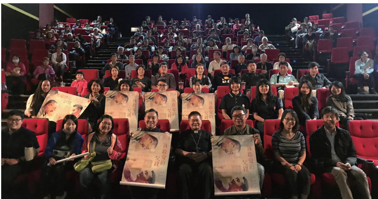
高雄場特映會大合照