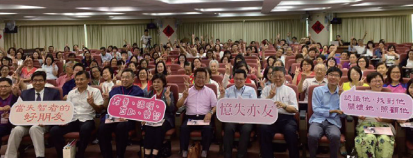
貴賓及學員大合照，為論壇揭開序幕

血糖控制都需要醫療和照顧。現在奶奶以樂觀的態度和大家分享她的生活，如何和失智症這個疾病共處。知名主持人侯昌明先生陪伴失智父親19年，他用輕鬆樂觀的態度，分享這一路是如何和太太彼此相互支持，以及如何堅強的態度面對父親在失智病程中的重複、遊走、妄想、藏物等問題行為，還要面對在照顧過程中親友、外界的誤解與質疑，最後特別提醒與會者對家人的異常要保持敏銳度，更重要的是照顧者一定要照顧好自己的身心。