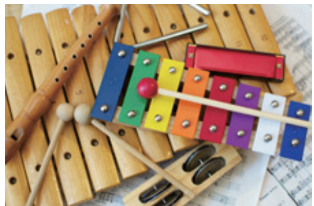
常用的音樂治療樂器

音樂治療是在治療性關係當中，藉由音樂達到個人生理、情緒、認知、社會的需求，合格的音樂治療師會評估每位個案的優勢能力，並運用不同治療手法，包括創作、