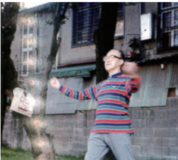
健身養心，持之以恆

獄期間，正處在痛苦煎熬的同時，仍禁不住良心的催促，關心一位患有精神疾病獄友無辜受虐，當情況危急時，他甚至以禁食禱告向主祈求，經過一段時日的努力與關懷，這位獄友竟奇蹟式的恢復正常神智，並得到獄方公平的對待。