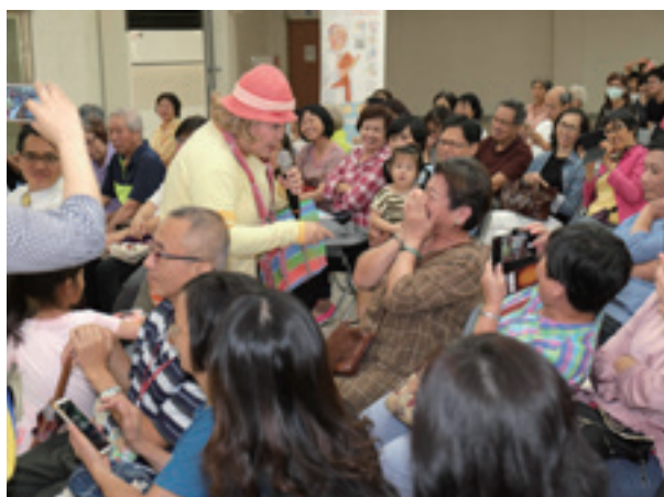
阿嬤妮走下台和民眾熱烈互動

根據統計，全世界目前已超過4,900萬人罹患失智症，平均每3秒就會新增一個案例，專家推估，台灣目前已超過26萬人罹患失智症，除了基金會這幾年努力在讓大家認識失智症疾病之外，也希望能降低失智症的罹患率，而依據2014年國際失智症協會研究指出，罹患失智症的危險因子有年齡、家族史、唐氏症候群、基因(ApoE4)、高血壓；膽固醇、肥胖、心血管疾病、糖尿病、憂鬱症、腦外傷、這些因素會使罹患失智症機率提高，而若要降低風險，需藉由自我管理安排來改變生活習慣，即可達到預防失智效果，而失智長者透由自我管理的學習，可延緩病程退化的時間。