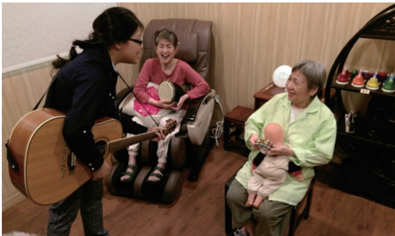
音樂治療能促進現實感與專注力，最重要的是能讓長者們開心地參與活動！

American Music Therapy Association (美國音樂治療協會網站)： https://www.musictherapy.org/ Music therapy and Alzheimer's disease. (音樂治療與阿茲海默症). American Music Therapy Association (美國音樂治療協會) 中華民國應用音樂推廣協會網站 http://www.musictherapy.org.tw/