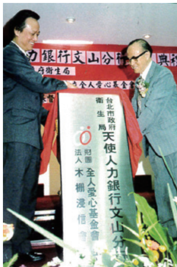
全人愛心基金會主辦衛生局天使人力銀行文山分行揭幕

認識了主的愛，也體認到愛才是一切力量的來源。因此當他冤獄案被平反後，將冤獄賠償金併加自己私人的儲蓄，創立「財團法人台北市私立全人愛心基金會」，又與台北市政府衛生局合作成立「天使人力銀行文山分行」，特別關顧貧弱長者，且新創志工服務時數累積與提領存摺制度，回饋志工本人或需要接受服務的家屬，並為服務達一定時數的志工投保全年意外險。