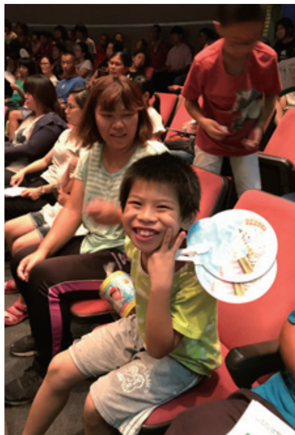
小朋友喜歡舞台劇爭相搶著拍照