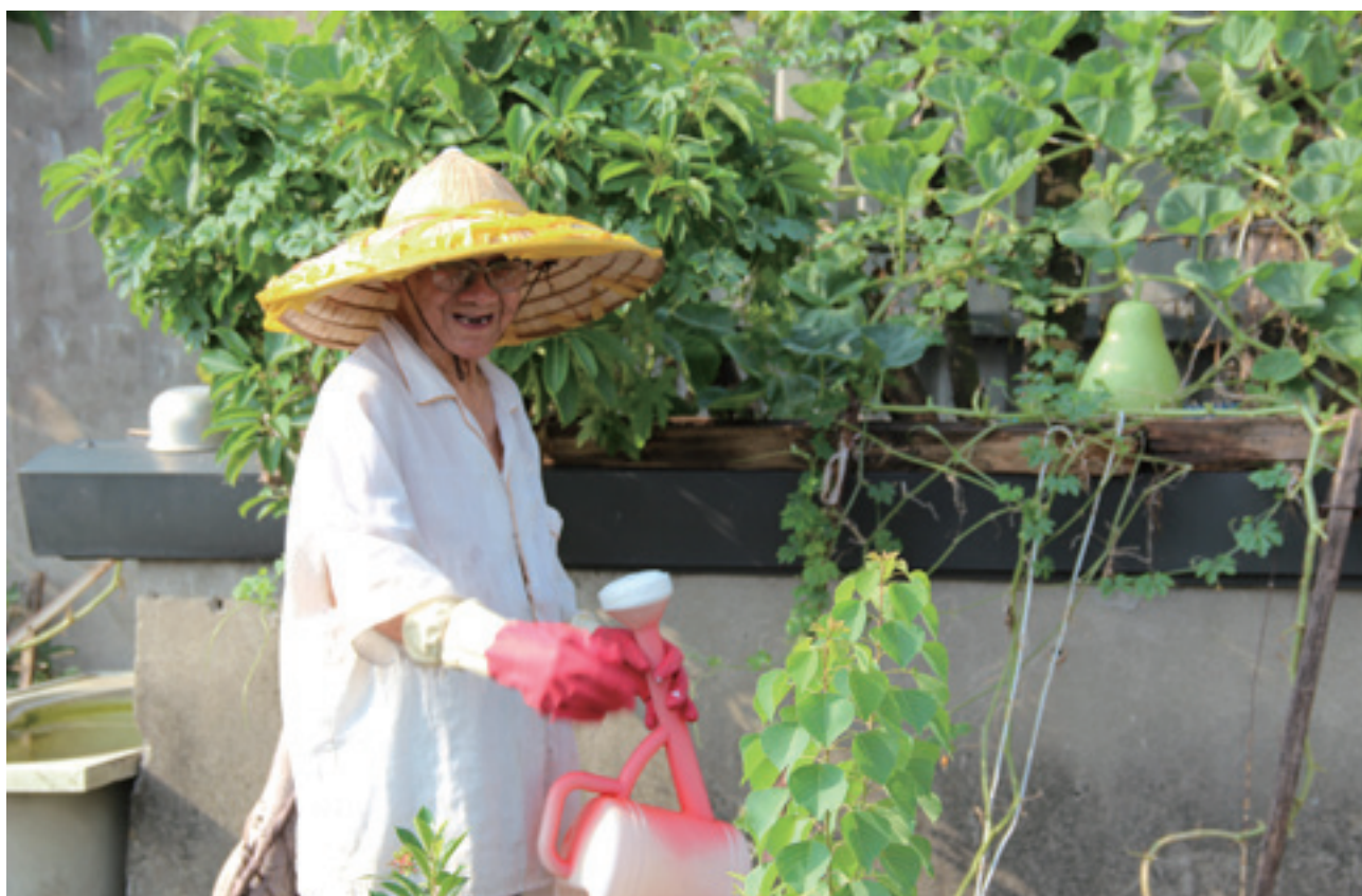
細心照顧小菜園，澆水撿菜都自己來