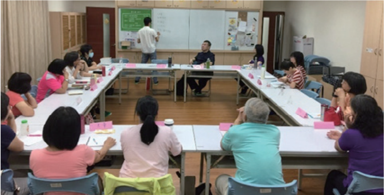
由兩位帶領人帶領的工作坊，學員專注聆聽

物、作出決定、行動計畫、呼吸技巧、了解情緒、解決問題、運用思考、睡眠、溝通、健康飲食、體重管理與醫護人員合作。工作坊由兩位帶領人促進成員間互動，相互腦力激盪與形成團體約束力，協助長者針對自身的行為健康問題設立合理的目標，發展與執行適合自己的、符合個人喜好、可行性與持續性的自我管理行為，進而達到主動與積極地改變生活型態。