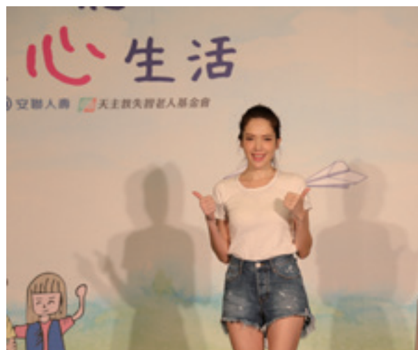
活動代言人許瑋甯

本年度活動也邀請到戲劇女神許瑋甯擔任代言人，並於7月12日再度與安聯人壽攜手啟動【愛在「憶」起·樂享心生活】募