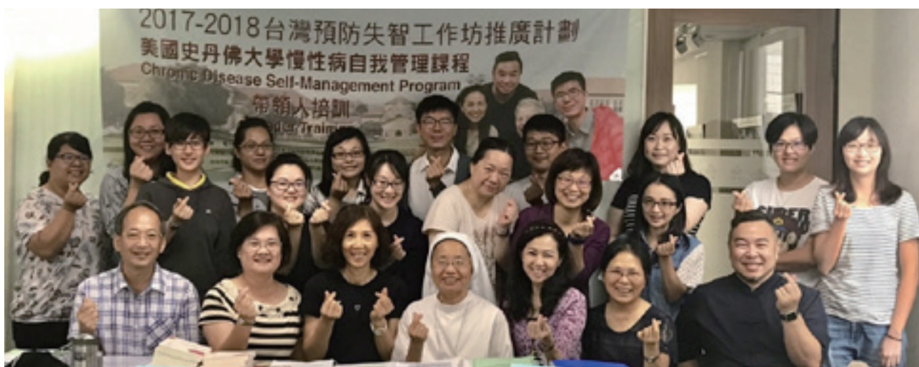
感謝財團法人天主教曉明社會福利基金會提供場地與協助辦理台中場課程