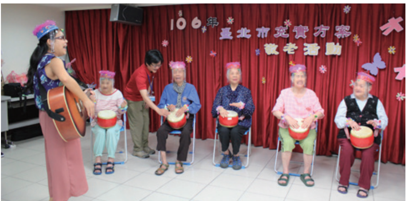
音樂治療能提昇失智長輩的認知功能

音樂治療師提供服務時首先會收集個案的背景資料，並且評估個案的功能、優勢能力，以及個案是否有生理、心理社會、認知方面、溝通等等需求，並依照他的能力與需求，訂立出符合全人照護計畫的治療目標，依照治療目標設計出個別化音樂治療計畫與療程，之後並定期進行再評估，以便根據個案的能力變化或治療目標達成狀況，適時調整治療目標或重新擬定治療計畫，一般而言，當治療目標完成且個案已經沒有其他音