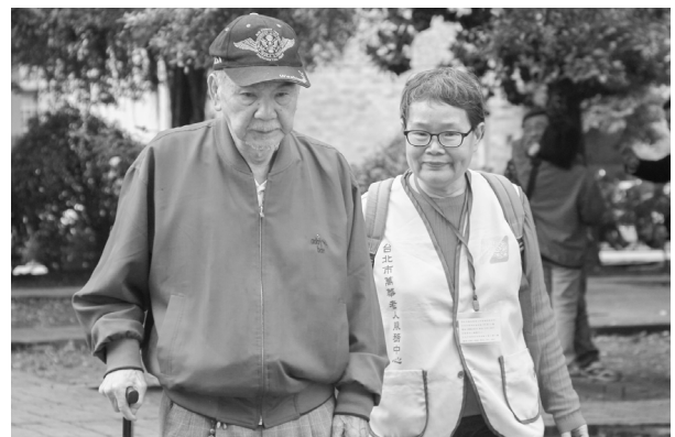
陪伴，對長輩是最好的關懷

老，也可能會碰到失能的問題，需要他人協助。她很感謝上天賜予她健康，讓她現在有能力幫點小忙，服務人群，也使她在服務過程中得到快樂、成就感和充實的生活。這是她當初只因為具備有機車、駕照和閒暇時間就投入送餐志工行列的單純動機，是想都想不到的收穫。