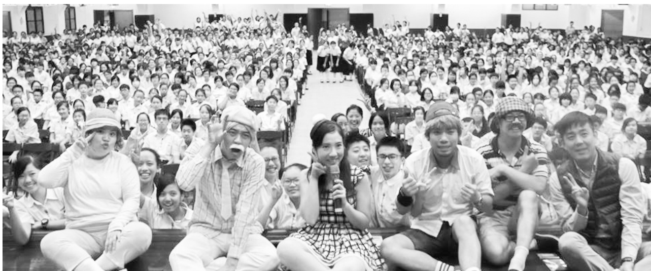
基金會曾家琳企劃專員（右一）及演員，一同與靜修女中同學合影