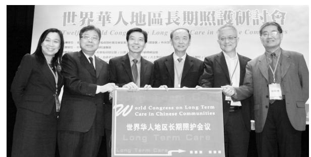
會旗交接，第13屆世界華人長期照護研討會預計將於2016下半年北京舉辦

兩天會議共有50多場次的專題演講與學術口頭發表，藉此更深入了解從健康照護、友善環境、整合服務、創新策略去建立全方位的老人服務，最後，海內外專家並從200多篇論文選出其中8篇頒給優秀論文獎，大會期盼對華人社區今後長期照護的發展將有重要的正面影響，並相約明年北京見。