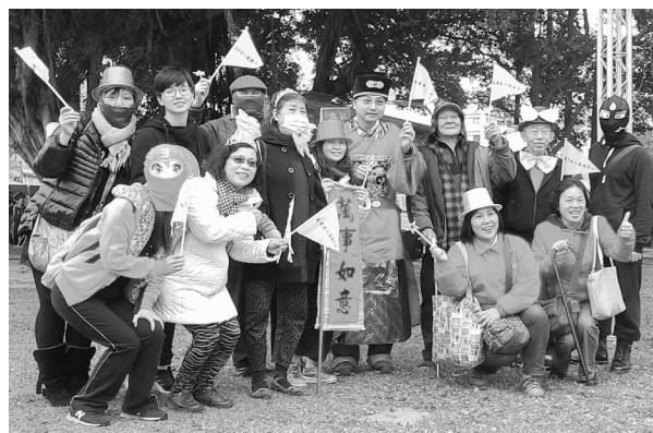
艋舺踩街-長者志工一同遊街

辦理包含端午、中秋、母親節、父親節…等節慶活動、銀髮活力園遊會、義剪義診服務、老人旅遊活動、重陽學苑成果展、教師節慶祝週、會員慶生會、社區圖書館…等活動，年度共辦理28場次。