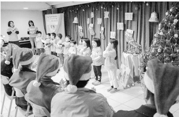
聖誕節老小歡樂共融

為凝聚照護共識，持續進行家屬支持與關懷團體，鼓勵彼此分享互相支持，一起面對疾病退化過程。家屬是我們照顧團隊中重要的伙伴，謝謝他們總以行動支持，在中心所辦理的各類活動中踴躍出席陪伴長者，甚至服務其他長輩或擔任志工，給予照顧團隊成員高度的肯定和鼓勵。難能可貴的是當中也有少數家屬，即使家人已過世，仍持續參與在團體中，並擔任志工協助我們給予長者服務。