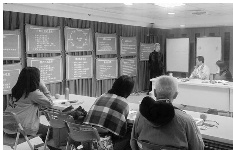
家屬自我管理上課情況

◎對象：60歲以上民眾或失智症照顧者皆可報名（因每梯次限12位名額，惟以前述慢性病患者優先錄取，敬請見諒！）