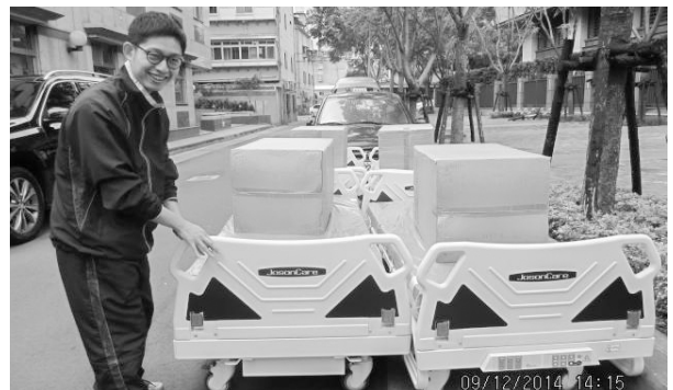
善心人士捐助汰舊寢室設備

申請衛福部充實設施設備獎助，進行養護中心部份設施設備汰舊更新，包含寢室設備、傢俱設備、護理設備，另添購復健設備等共計24個項目，以期為長者打造更優質舒適的生活空間，特別感謝善心人士的捐助，協助我們逐步進行環境的整理與更新。