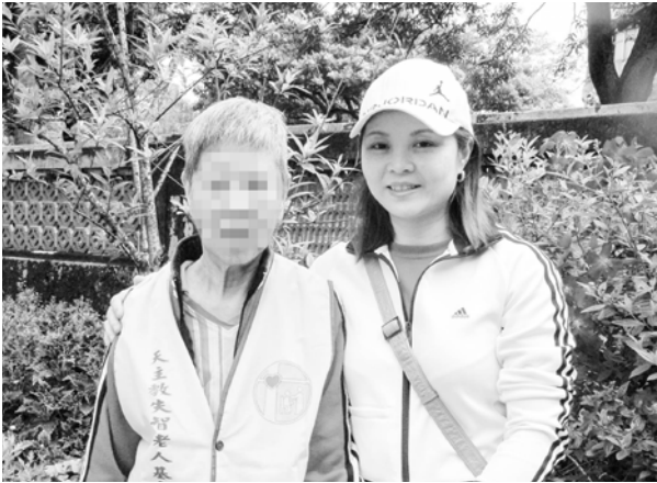
工作人員陪同參與中心旅遊

車子在蜿蜒的山路緩緩盤旋上山，冬天的陽光暖暖的灑在身上，揹在胸前的您難得如此靜默，此刻起不用再擔心四處遊走的您又不見了、不再聽到您與人搶奪圍兜的爭執叫罵聲……長眠在依山望海的樂土，是最後能為您做的，也許您從來就不記得這段辛苦的歷程，但它卻在我們的記憶裡刻下難以抹滅的痕跡……。