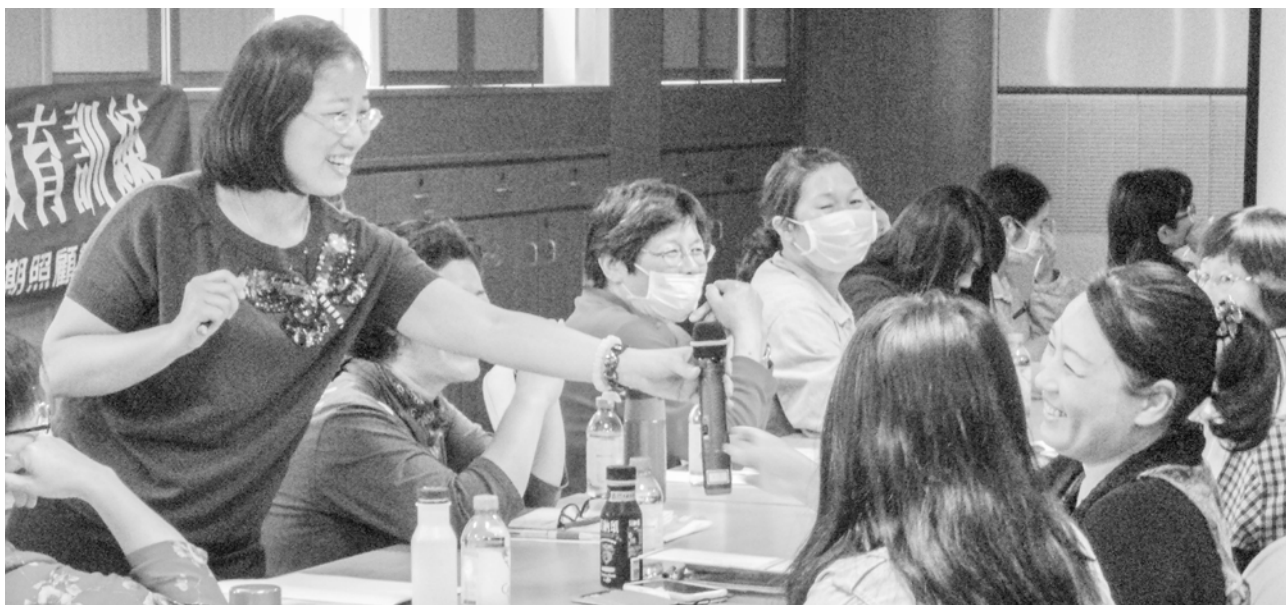
澎湖場家屬課程講師與學員開心互動

有一位去年曾參與的家屬分享表示，課程帶給了他很多正面的支持力量，希望能持續參與基金會的課程和活動。家屬的改變是我們很大的支持與鼓勵，縱使辦理離島課程充滿挑戰，也需要耗費較多成本及時間，本會仍會繼續努力，希望還沒上課的家屬也可就近報名參加。