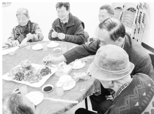
獨居長者圍爐活動(左二)

之後，在持續性的關懷下，奶奶漸漸地接納我們，第一次，終於參與了中心「長者外出一日遊」活動，那天她很興奮地笑了，告訴我們她好幾年已經沒出來旅遊過，感受到她發自內心的開朗，那是她的第一步，也是我們服務成就的第一步，現在，奶奶總是不定期地主動詢問「這個月有什麼活動啊？」甚至成為老人中心大小活動的固定班底。