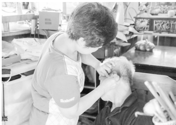
居服員協助定時點耳藥

少年不說需求，或說不出需求似乎也無法進一步的協助。案家是傳統紅磚房後面加蓋的鐵皮屋，屋內空間環境狹小，雜物多，沒有熱水器、微波爐等電器、悶熱、不通風，老爸及少年同住在一張雙人床。