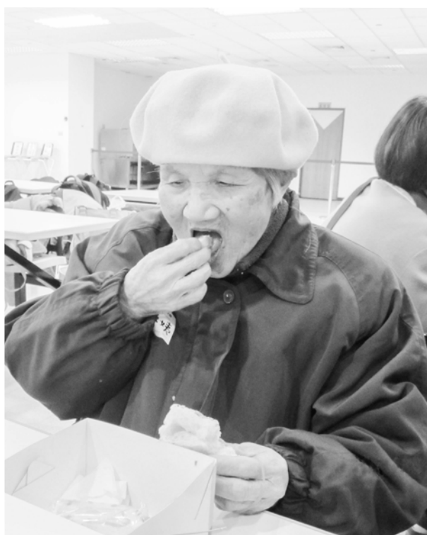
提醒長輩吃東西需小口及專心

在整個吞嚥過程中，食物的移動是快速的，故時間是一個非常重要的元素，每個吞嚥器官都要在特定的時間內精準的掌握自己的吞嚥責任與功能。食物從嘴巴進到胃只經歷3秒鐘。也就是口腔期、咽部期及食道期各1秒鐘。在每個1秒鐘，食物都要被引至到正確的器官與地方。如果吞嚥器官動作及功能不佳、與器官之間不協調，時間控制不好，都可導致吞嚥問題。例如：當食糰已進入咽部時，環咽肌未張開，很有可能會導致食糰不小心進入喉部系統的現象。