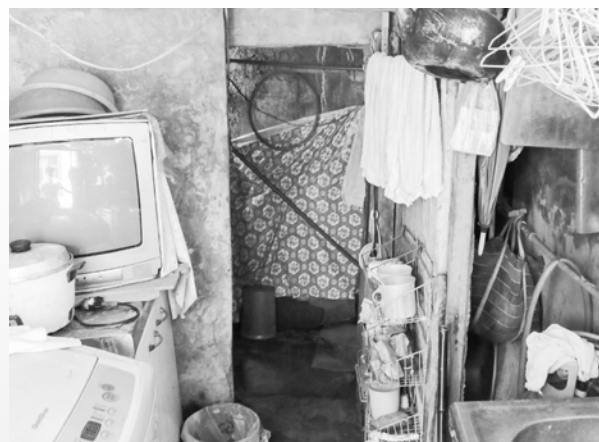
環境簡陋，設備年久失修

目前提供居家服務的狀況平穩，僅偶爾老爸會到附近走走，忘記在服務的時間返家外，在服務初期有騷擾服務員的狀況也已經消失，失智症的病程發展目前也無法預測案主的發展，居家服務僅能盡量協助維持案主的日常生活穩定，社工將定期關心案主的發展及案家的需求及時給予協助，希望能協助案家，陪伴案家平穩地渡過接下來的日子，也衷心祈禱案家能有機會改善生活環境、經濟狀況及生活品質，就一起祈禱天主保佑囉！