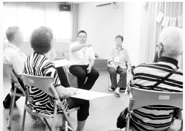
101年人生的滋味團體

服務初期，萬華老人服務中心透過定期的電話問安、到府關懷訪視、物資贈送等服務，關心張奶奶的生活近況，慢慢地觀察到她的一天，不是在家中呆著，就是在樓下坐著，或因老年疾病往來醫院。社工曾詢問平時還會去哪裡活動嗎？奶奶回答：「我無處可去！」這句話至今都讓我印象深刻，詳細瞭解原因，才知道奶奶原來與媳婦相處不好、兒子正辛苦負擔著先生的養護所費用，以及自己遭親友騙錢等家庭事件，讓奶奶心中有很多心結及負面的情緒，不知道自己能為孩子做些什麼，能做的就是過一天算一天。