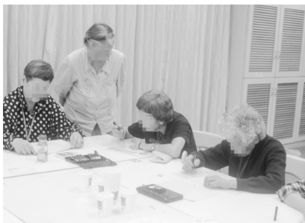
102年面對自我·樂活人生團體(左一)

社工期望透過老人中心的服務，能減少一些的心靈空虛，降低些少的憂愁，期許我們能為她的生活帶來不一樣的面貌。因此中心非常積極地邀請她參與大小節日、旅遊、團體等活動，剛開始，奶奶總是以至老人中心需要花費車程約30分鐘，加上腿力不好，婉拒前來參加。