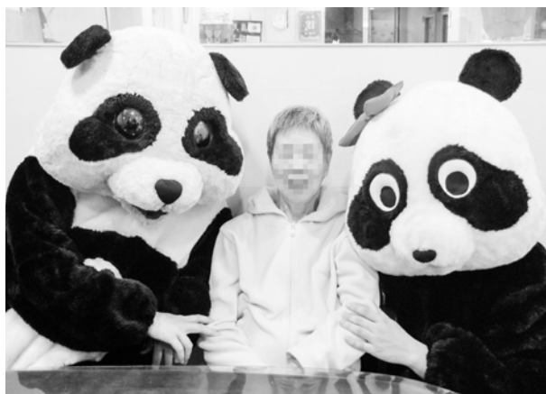
聖若瑟週年慶與熊貓同樂

同時社工與護理主管亦輪流到醫院探視關懷。這段辛苦的处理過程，或許讓同仁們經歷了許多人生中的「第一次」，也是因為這許多的第一次，我們之間的關係，從原本單純的服務關係，變得更緊密與複雜了，您儼然成為我們非親非故的「家人」，難怪部份同仁叫您阿母，告別式中搶著當您孝女，還一路陪您到終站。