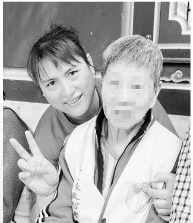
她們像不像母女呢？

另外，您無親友，加上對不熟悉的人又較難接納，協助您就醫，就必須靠團隊的努力與合作，因此當護理人員評估您需就醫後，先幫忙掛好愛心號(您無法久候)，通知社工安排交通工具，安排照服人員陪同就醫，若是需要住院，您的情緒問題，經常不是醫院合約看護能應付的，加上您敏捷的身手，看護稍不留意，您可能就離開醫院四處去遊逛(這是您曾有過的紀錄)，因此，社工必須立即尋找熟悉失智長者的看護來協助，