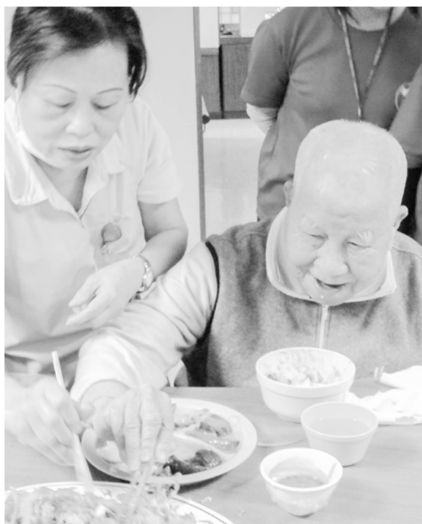
吃是件重要與愉快的事情