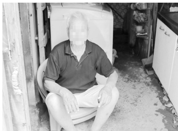
家門口是案主最常坐的位置

關於少年，滿十八歲，目前正在夜校讀書，假日上課，過往下課後到便利商店上大夜班，近期則因車禍，大腿髌關節處設置鋼釘，無法負重，現在在加油站打工，老爸對他來說過去是個麻煩製造者，現在則是無法擺脫的負擔，因為少年是唯一照顧老爸的人，除了親情的牽絆之外，貧窮也是面臨的困境之一。未來希望可以從事餐飲業，擔任廚師的角色，在照顧父親之餘努力讀書，目前已考取廚師證照，離夢想也慢慢更進一步。