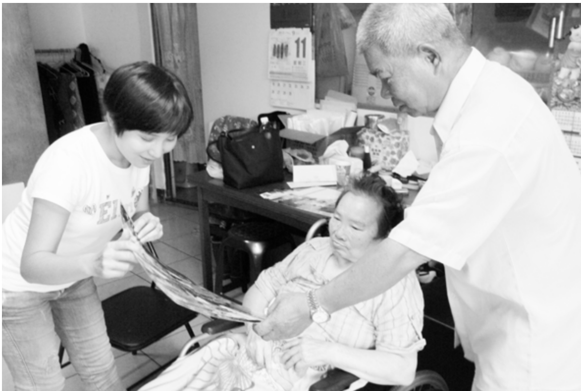
透過照片與太太回憶當年

身為一位男性照顧者在照顧經驗要學習的部份會比一般女性來的多，陳阿伯一直努力在學習。而陳太太因下肢無法活動的關係，24小時有人全天照顧，陳阿伯根本無法