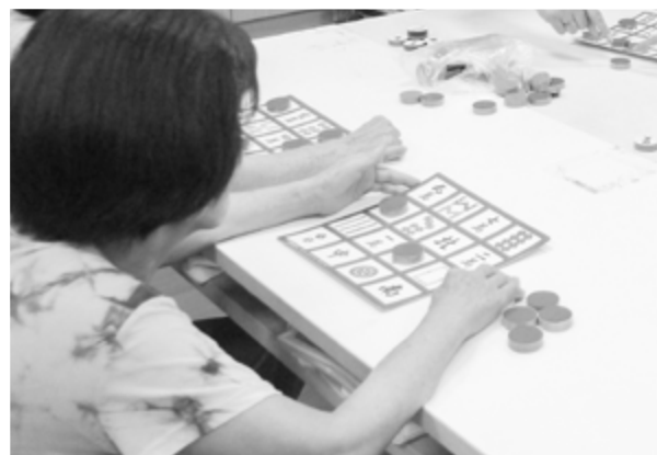
認知活動-融入麻將元素的麻將賓果

的元素，比較容易達到效果，例如失智者過去喜歡打麻將，雖然目前已經無法順利完成，但我們還是可以鼓勵患者在支持的環境下（配合他的速度或暫時忽略患者的錯誤）繼續執行這個他熟悉及看重的活動，相信意願會更高得多。