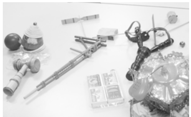
懷舊活動-懷舊物品-童玩