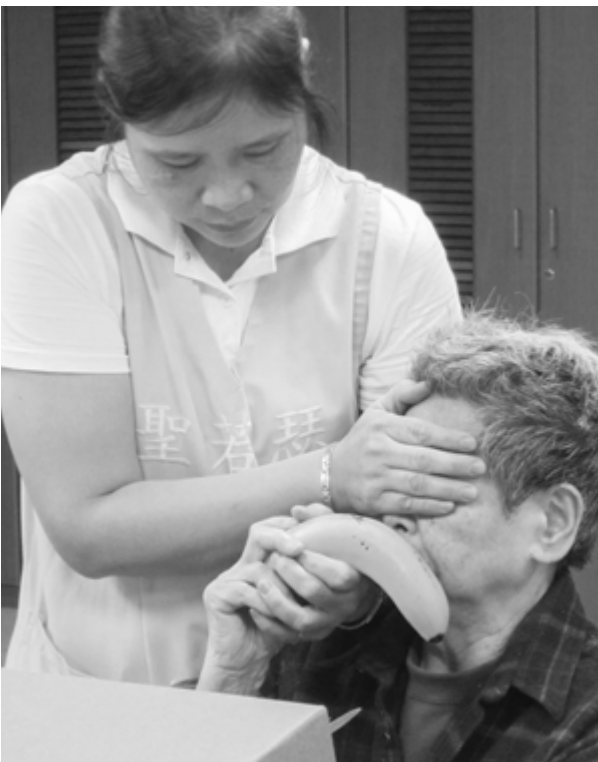
感官刺激活動-透過觸覺與嗅覺猜水果

1 肢體活動：顧名思義，此活動期待維持失智患者的體能與肢體活性。因此除了我們熟悉的做操、運動之外，可以運用簡單的遊戲改變成患者可以動起來的媒介。例如音樂律動、丟接球、打槌球、拍氣球……等肢體團康活動皆可運用。