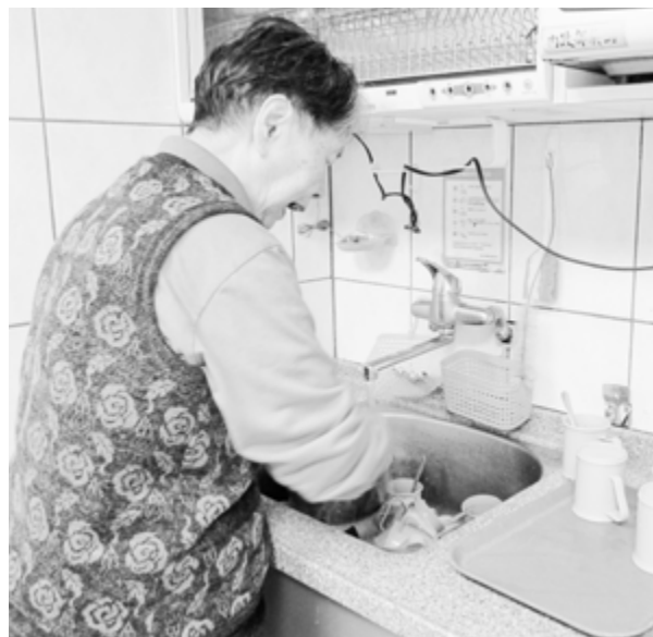
日常生活活動-洗杯子

中間尋求一個平衡點才是。很有趣的是，根據研究發現，家屬去看失智症患者的生活品質，往往比患者自己本身自覺的差，也可以這麼說，患者自己不一定覺得他的生活有那麼不好或不正常。