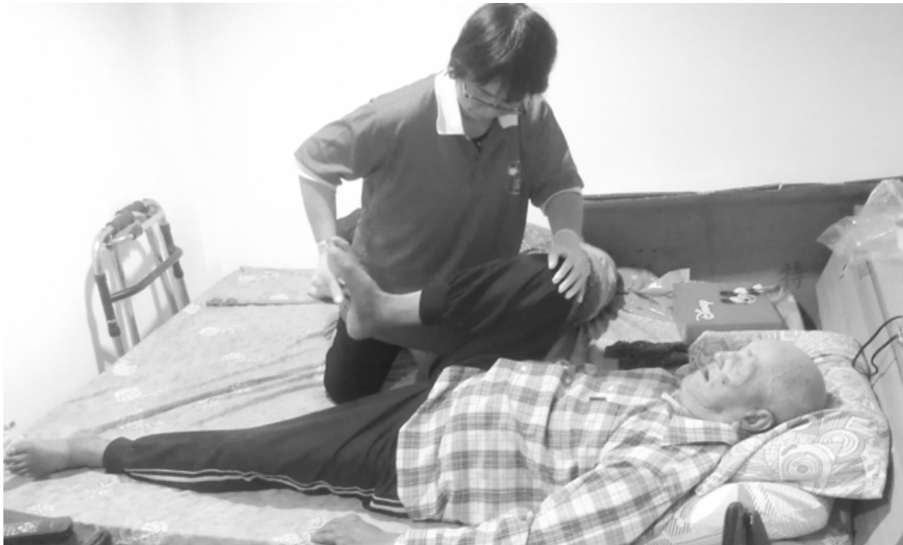
案主臥床，居服員正在協助肢體關節活動(下肢)

面對家中有失能或失智長者，家屬往往承受莫大的壓力，一方面要工作維持家中經濟，一方面要花費心力照顧，在兩者重擔之下，家屬無暇兼顧，藉由居家服務的介入，減輕家屬長年的照顧壓力，身心獲得喘息，也能讓缺少關懷及陪伴的獨居老人，獲得一絲溫暖。