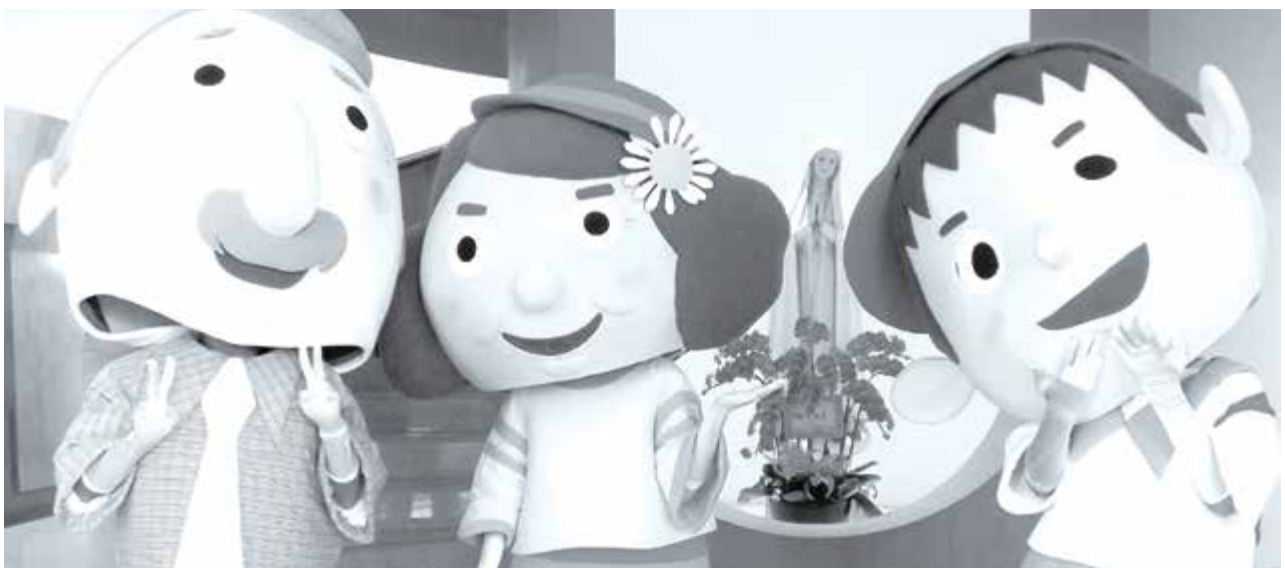
現場最受歡迎的是3位超級主角大頭人偶，大家搶著和他們拍照，他們卻希望與聖母瑪利亞合影。