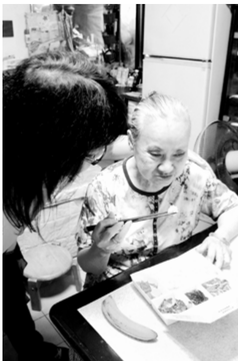
送餐志工溫暖了每一位長輩的心

萬華老人中心提供週一~週日午、晚兩餐送餐服務，每天約需12個志工幫忙真的，「阮摺有欠人，志工不夠多邀請幾個來」。只要您年滿18歲具機車駕照，自備摩托車且每週提供一次服務以上，均歡迎您一起來奉獻愛心送餐到家！