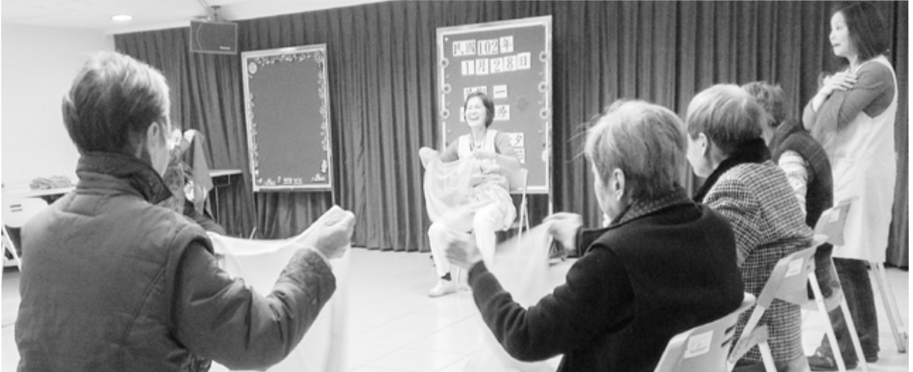
音樂活動-拿著紗巾隨音樂舞動