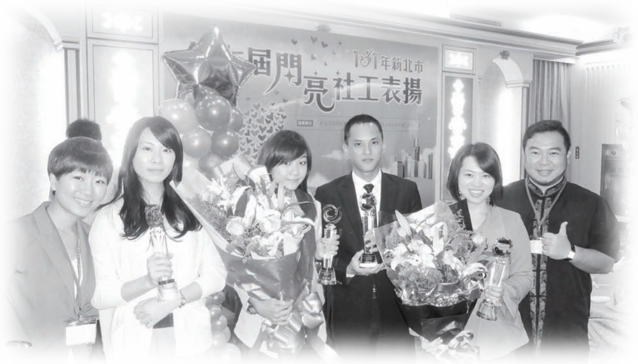
得獎社工與基金會同仁合照