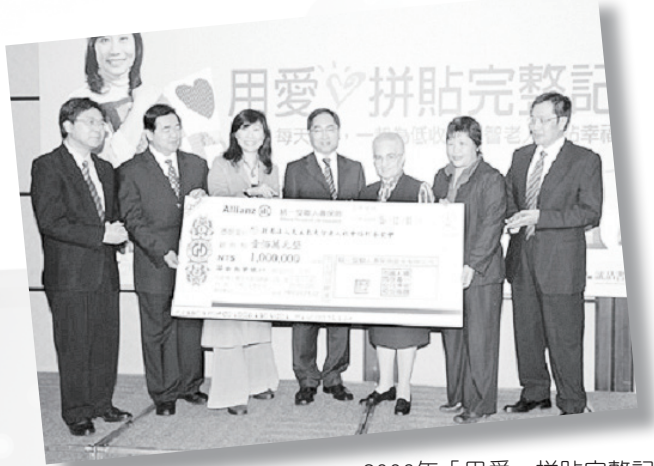
2006年「用愛，拼貼完整記憶」活動，由郎祖筠代言