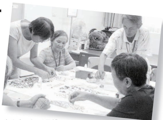
老人身心活躍團體

台北市政府社會局於97年8月以公辦民營模式委託財團法人天主教失智老人社會福利基金會成立台北市萬華老人服務中心。100年度中心業務執行內容包含：提供弱勢長者個案服務、福利諮詢服務、老人文康休閒服務、老人健康促進服務、志願服務推展、老人團體服務、老人健康餐飲服務、社區外展服務…等工作，全年度計20項業務計劃，多元項目累計服務成果達 73,882人次。其中重點服務方案：