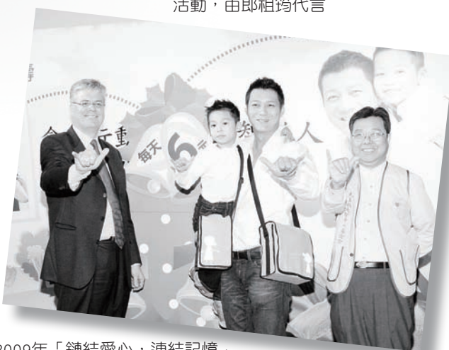
2009年「鏈結愛心，連結記憶」活動，由聶雲父子代言

好夥伴。2012年，我們亦將持續攜手，宣導大腦保健的預防教育，從大腦活化出發，以記憶訓練為主軸，推動健走活動，並設技製作桌上遊戲，搭配健康飲食創造好玩、互動性高的桌上遊戲，透由遊戲訓練左右腦平衡，並建立社交、人際關係等。