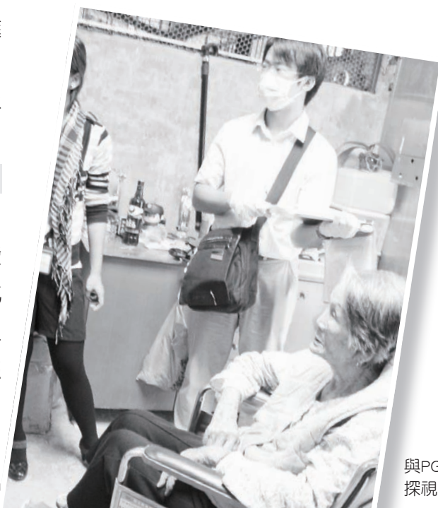
與PGYI醫師合作 探視本會居服長輩

持續與耕莘醫院體系之醫療、護理、社服、牧靈、復健、營養等專業團隊合作，以期提供本會個案符合「全人、全程、全家、全隊」的四全照護理念。