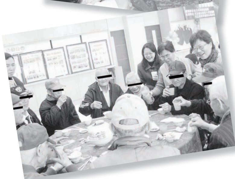
↑↑居家關懷 ↑長者春節圍爐送暖