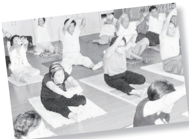
老人學苑-養生瑜珈班