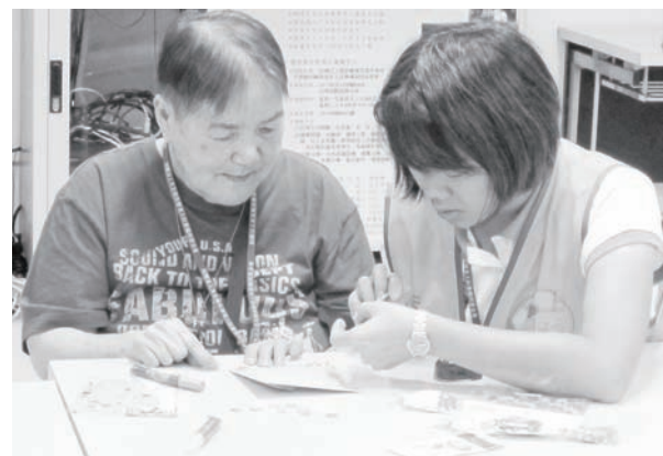
一點一滴灌溉服務精神