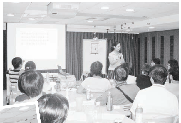
↑實習與代訓 ←家屬支持服務