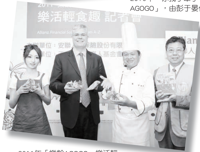
2011年「樂齡AGOGO，樂活輕食趣」，由柯佳嬿代言