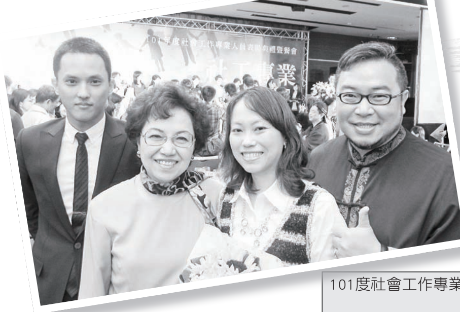
台北市社會局江綺雯局長蒞臨致賀