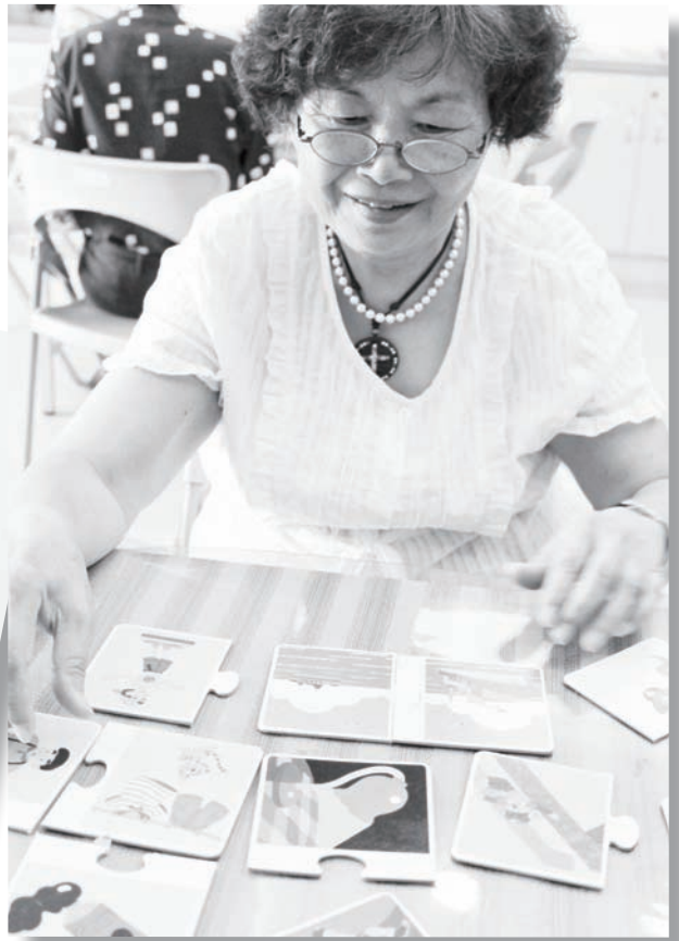
玩拼圖是一種很好的記憶訓練遊戲

且帶來空間記憶能力的改善，進而活化大腦（Neurology. 2010;75:1415-1422）。