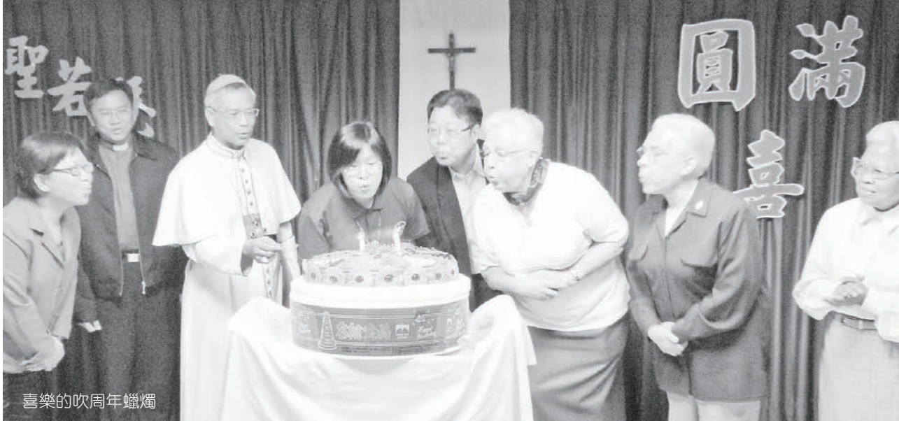
喜樂的吹周年蠟燭