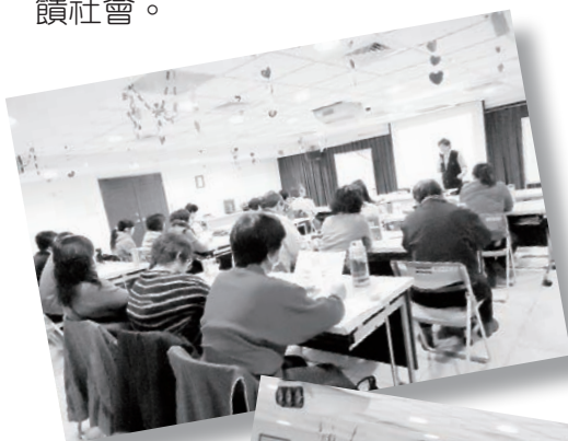
基礎訓練課程 在職教育課程

1-12月服務總時數為17902.5小時，秉持著愛主愛人的精神，努力地付出，用心回饋社會。