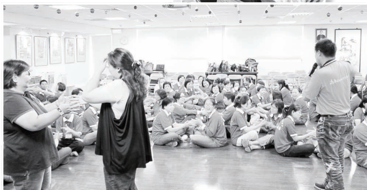
居服員教育訓練 - 如何凝聚團體共識