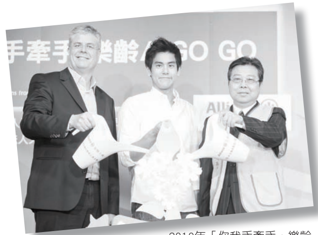
2010年「你我手牽手，樂齡AGOGO」，由彭于晏代言