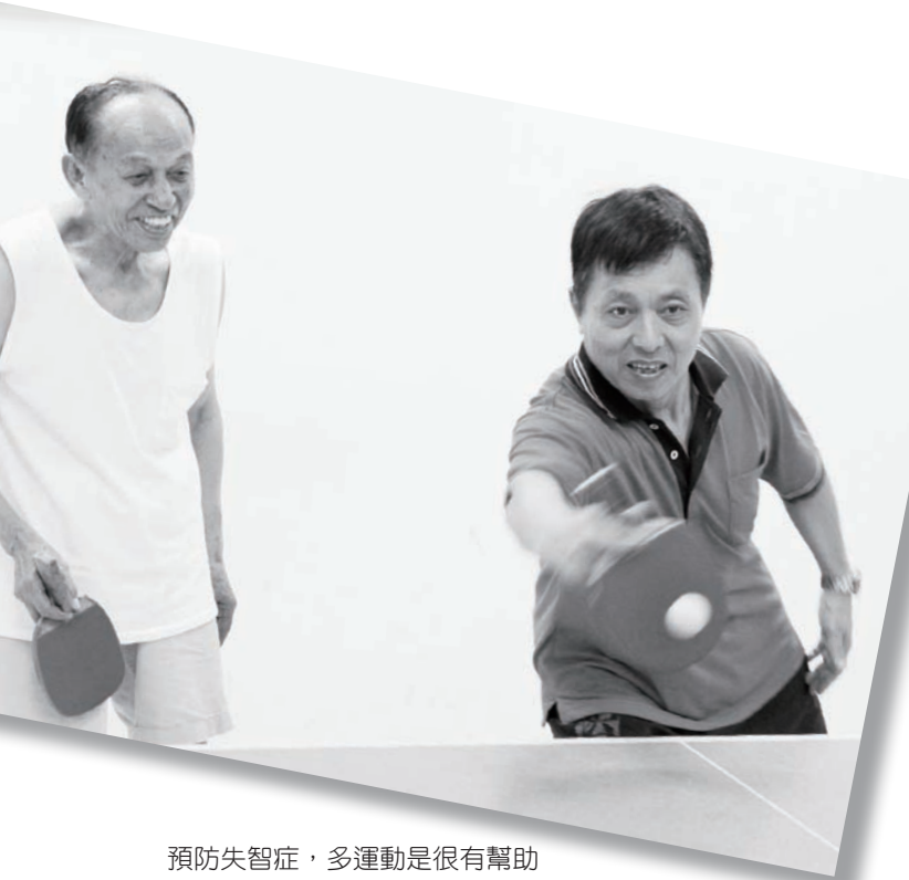
預防失智症，多運動是很有幫助