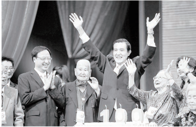
馬英九總統及行政院副院長江宜樺，與百歲人瑞共慶中華民國生日，為本活動揭開序幕

而本會長年提倡活躍老化，鼓勵長輩積極經營老年生活，並慶祝中華民國過建國一百年，在內政部的經費贊助下，本會與台北富邦銀行基金會共同辦理「精彩100阿公阿嬤青春大擂台」活動，在