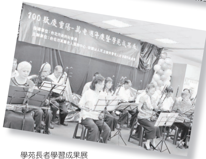
學苑長者學習成果展

中心在體系【愛主愛人、尊重生命、四全服務】的理念基礎上，將全力達成【透過多元、專業、團隊的服務，協助萬華社區老人解決問題、維持社會功能、提升生活品質】之機構使命。