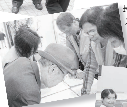
↑↑ 社區活動支援 ↑ 支援活動