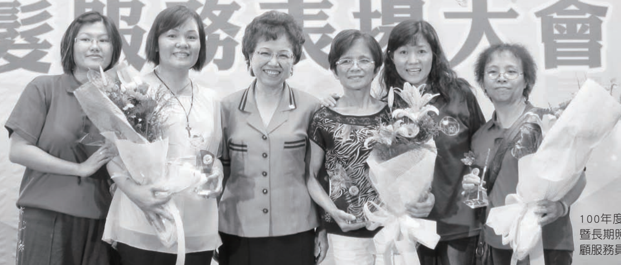
100年度老人安養暨長期照顧機構照顧服務員表揚