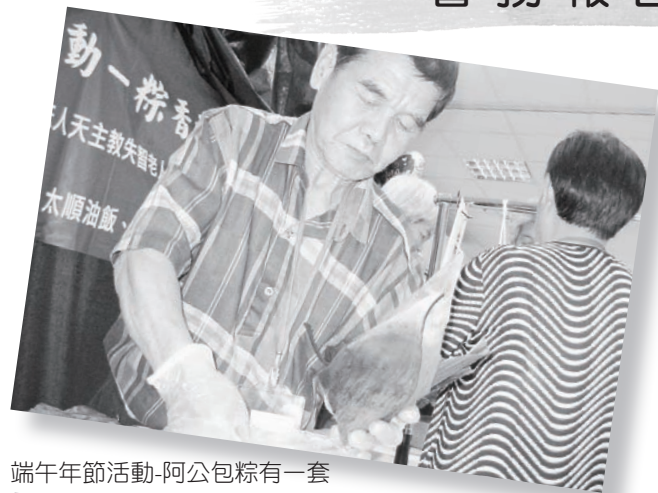
端午節活動-阿公包粽有一套