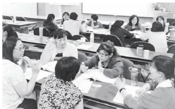
三階段學科南區場_小組討論與交流

階段整合式訓練－失智症教育推廣人才培訓」，以培訓失智症種子教師於全國各地全面提升照顧人員的專業技能發展失智症照顧資源。今年度分別於北區及南區辦理兩場次，課程規劃包含五天失智照護知能學科課程、一天成人教學工作坊課程、五天失智照護實務研習及教案發表演練三個階段，參訓學員共計88人，完整完成三階段完訓之學員共計74人。