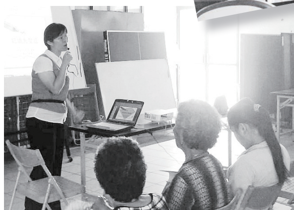
家照班綠島場_學員用心聽講

階段整合式訓練－失智症教育推廣人才培訓」，以培訓失智症種子教師於全國各地全面提升照顧人員的專業技能發展失智症照顧資源。今年度分別於北區及南區辦理兩場次，課程規劃包含五天失智照護知能學科課程、一天成人教學工作坊課程、五天失智照護實務研習及教案發表演練三個階段，參訓學員共計88人，完整完成三階段完訓之學員共計74人。