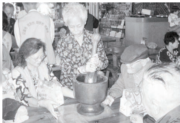
長者戶外郊遊活動