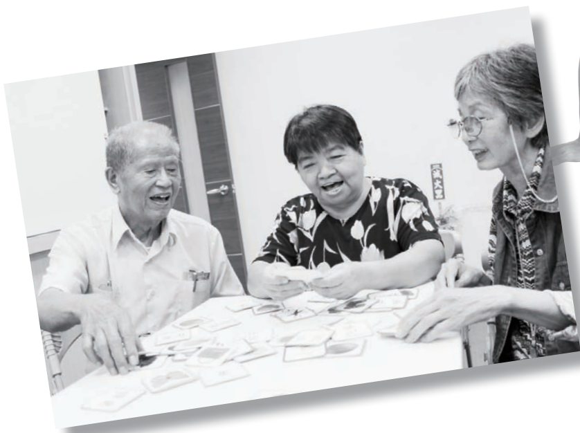
長者們開心完著紙牌遊戲

「2012樂齡A GO GO，樂齡·憶起GO」愛心捐款活動即日起至101年10月31日止，單次或定期捐款達1,000元(含以上)，即可獲贈「記憶訓練桌上遊戲」一組；並於9月1日辦理健走運動活動，邀請您我一同攜手牽著家中阿公、阿嬤走出戶外，健康運動，共同響應失智症預防（報名即可獲得限量時尚「運動毛巾組」），活動內容及辦法，將於近期內公佈，相關活動詳情請參考Facebook粉絲頁「樂齡 A Go Go」或天主教失智老人社會福利基金會官方網站 http://www.cfad.org.tw 、安聯人壽官方網站 www.allianz.com.tw 。或洽諮詢專線：(02)2332-0992。